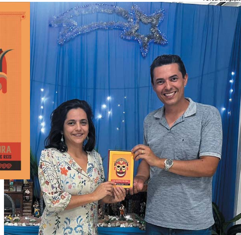
Autora apresenta o livro ao secretário municipal de Educação e Cultura

cas e aproveitando para conversar com estudantes sobre a importância das manifestações populares. Os livros serão todos doados a escolas, universidades, centros comunitários, bibliotecas públicas e a pessoas que estudam o tema. Segundo ela, as rodas de conversa nas escolas são parte do projeto: "Precisei correr e fazer as visitas antes do lançamento, porque houve atraso na finalização do livro e se eu demorasse perderia a oportunidade de visitar as escolas antes do término do ano letivo. Edital tem prazo para prestação de contas e estou na correria para finalizar sem prorrogação".