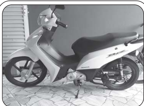
MOTO BIS/2017 BRANCA: vendo Tratar 35 9936-6408