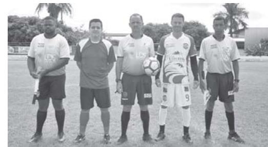
Organização e equipes definiram pela vinda de árbitros de fora nas partidas decisivas

Ele adiantou também que a data da partida final será definida em conjunto com as equipes e será acertada nos próximos dias.