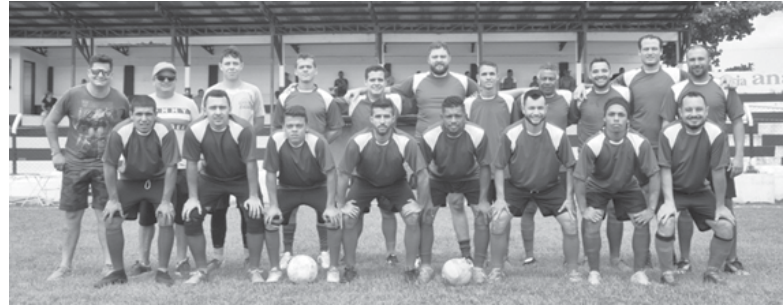
AABB eliminou o Senior's no tempo normal enquanto que o Paraíso F.C. derrotou Termópolis nas penalidades

Conforme informado pela organização da Taça Paraíso na semifinal e final a arbitragem será de fora. Nas duas partidas realizadas no domingo o