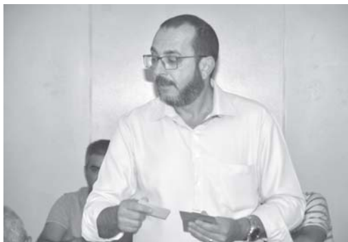
Gerente do Banco do Brasil falou sobre as linhas de créditos disponíveis aos produtores rurais

O Conselho Municipal de Desenvolvimento Rural Sustentável (CMDRS), de São Sebastião do Paraíso realizou sua reunião mensal, quando foram debatidos vários assuntos como a necessidade do recadastramento de produtor rural junto a Cemig e também as linhas de crédito disponibilizadas pelo Banco do Brasil. Outro ponto levado à pauta é o encerramento do 1º Concurso Municipal "Qualidade de Café", que terá premiação aos vencedores no próximo dia 28.