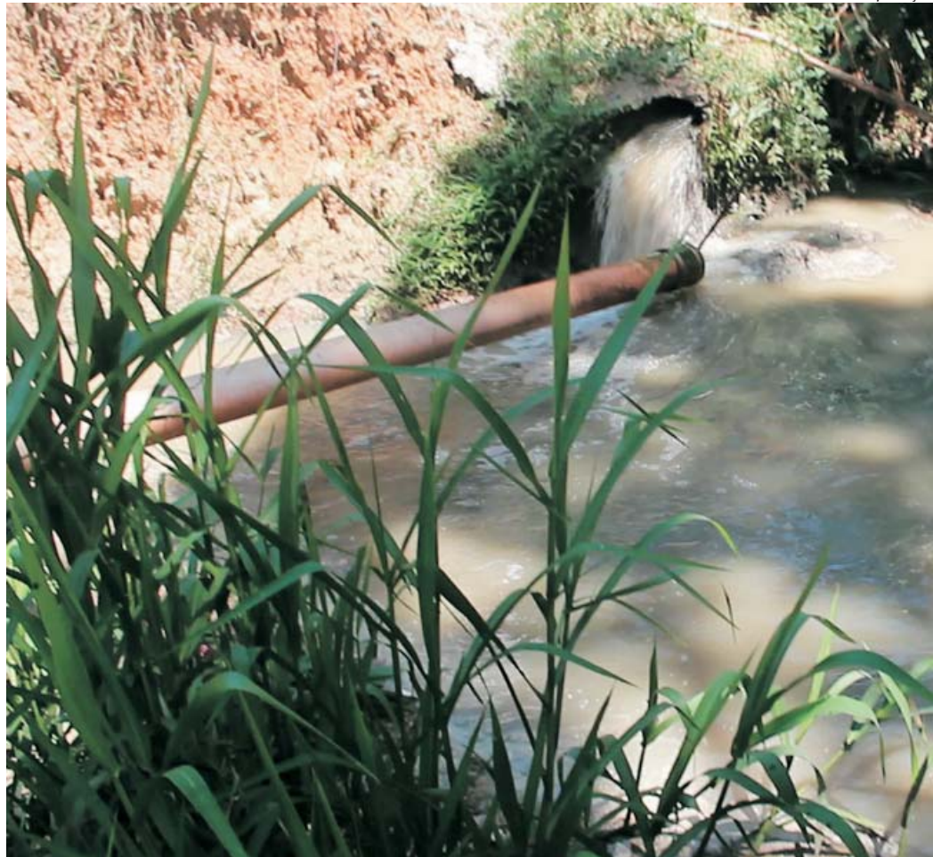
Vereadores denunciam degradação ambiental, poluição de manancial e prejuízos financeiros do cidadão e do Município

Córrego Coolapa cheio de mato pode reter água de chuva e ser foco de mosquitos