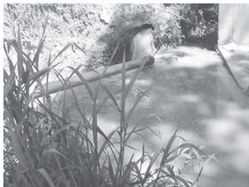
Vereadores denunciam degradação ambiental, poluição de manancial e prejuízos financeiros do cidadão e do Município