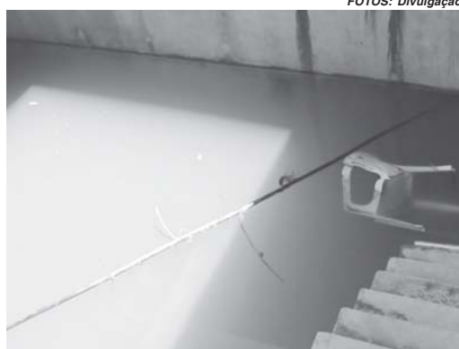
Vereadores estiveram no local e mostraram estado de abandono das obras inacabadas

Indignado ele aponta que a situação é de descaso total com a população, com a sociedade e as autoridades constituídas. “Isso que estão fazendo e do jeito que está é uma verdadeira afronta e já faz tempo que está deste jeito, sem que nenhuma providência seja tomada, porque eles têm a certeza da impunidade e até agora não foram punidos e nem responsabilizados pelos danos que estão sendo causados, ao homem, ao meio