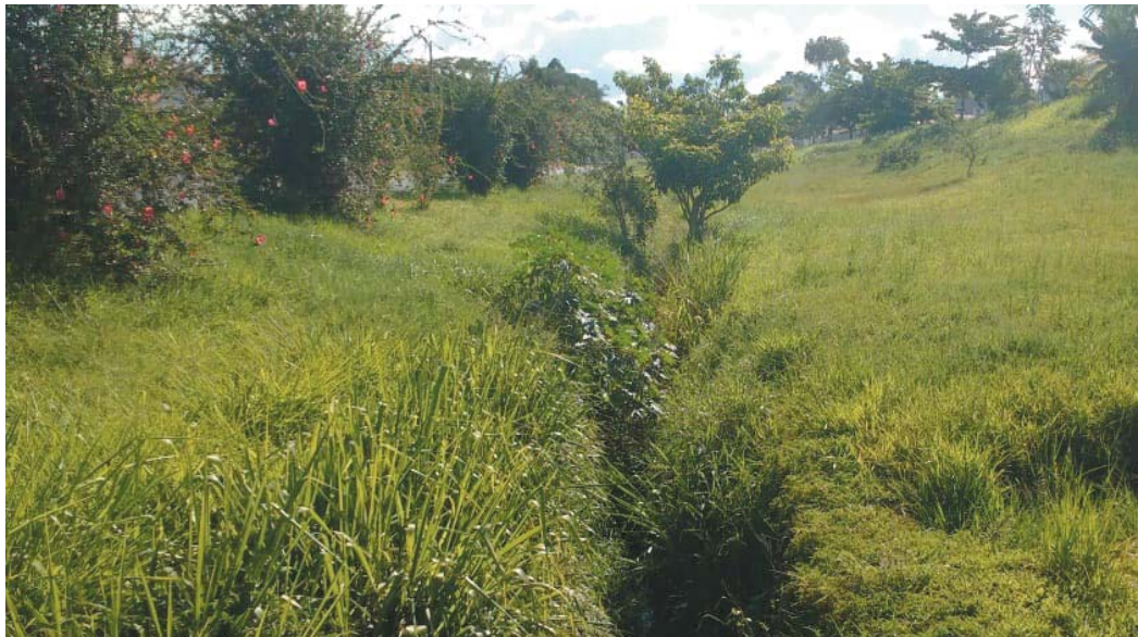
Vejam o matagal e até árvores nasceram dentro da canalização do Córrego Coolapa

Passou da hora do departamento responsável da prefeitura efetuar a limpeza do matagal na canalização do Córrego Coolapa, provável foco criadouro de mosquitos transmissores da dengue e outras doenças, alerta um morador que terá sua identidade preservada.