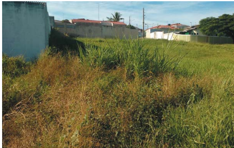
Este enorme terreno sujo de mato que fica de frente para a Av. Geraldo Pelúcio pertence a prefeitura