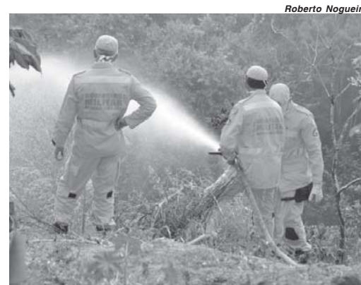
Bombeiros atuaram para conter o fogo em APP localizada entre o Jardim Canadá e o bairro São Judas Tadeu

Há cerca de duas semanas o Corpo de Bombeiros de Paraíso apresentou um resumo