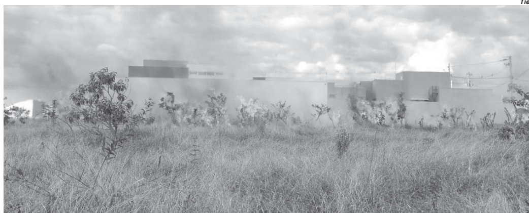
Com o vento focos de incêndio ganharam força e a queimada se espalhou pelo terreno chegando próximo às residências

Vários focos de queimadas de grandes proporções foram registrados no início da tarde desta quarta-feira, 15, em São Sebastião do Paraíso. Desta vez as ocorrências foram na Rua Dr. Pedro Bueno Júnior, no Jardim Mediterrâneo região próxima à Câmara Municipal, e também em uma área de preservação permanente no Jardim Canadá. Nos dois locais o fogo de origem desconhecida teve início por volta das 14h00 e assustou moradores e transeuntes que acionaram o Corpo de Bombeiros.