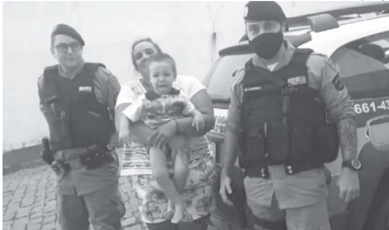
Após ser socorrida pelos policiais do Pelotão da PM, a criança foi devolvida para os braços da mãe