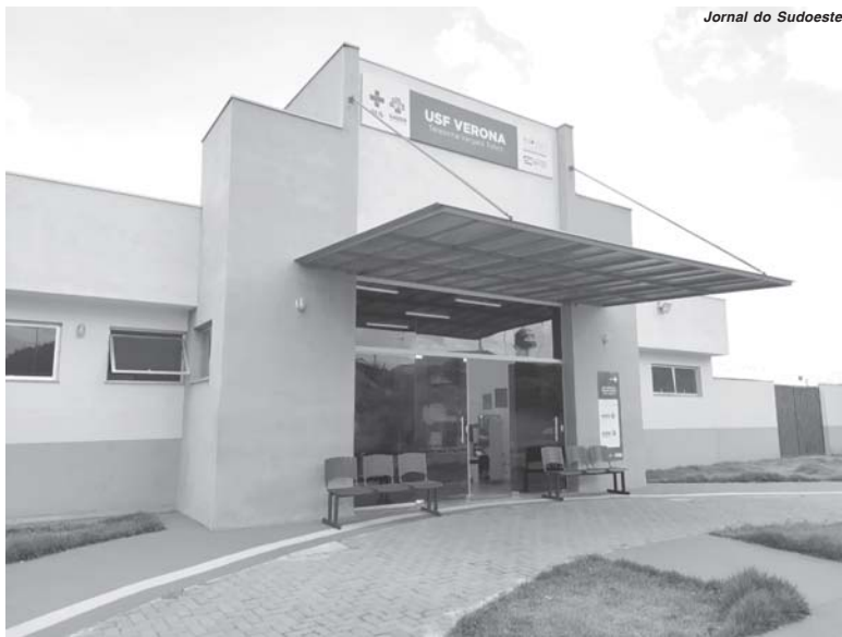
USF do Verona é um dos locais onde a Prefeitura realiza o revezamento de funcionários

É o caso das Unidades de Saúde da Família localizadas nos bairros São Judas e Verona. A mesma situação ocorre com a USF José Bento dos Santos (Asilo) e na USF Caic 3 que estão passando por remanejamento. "Assim estamos conseguindo atender