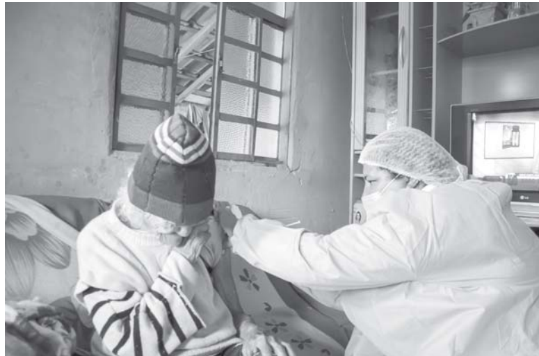
listados para ser vacinados foram imunizados.

Ainda no final de semana as equipes iniciaram os trabalhos e somente no sábado, 13, mais da metade dos idosos acima de 90 anos que estavam