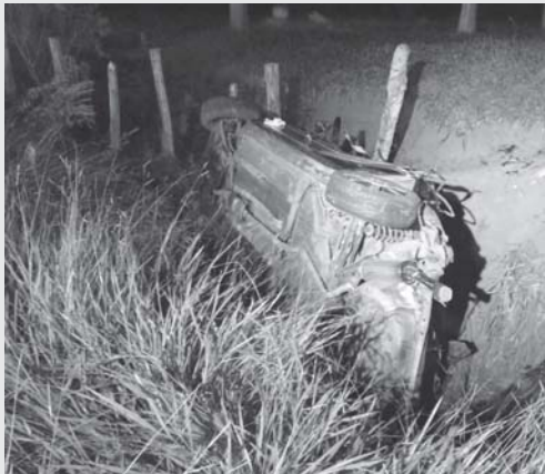
Veículo acidentado ficou fora da pista de rolamento e a alguns metros da pista

Equipes de resgate do 2º Pelotão do Corpo de Bombeiros e do Samu (Serviço de Atendimento Móvel de Urgência) de São Sebastião do Paraíso foram acionadas na madrugada do domingo, 3, para atendimento a quatro vítimas de acidente de trânsito. A ocorrência foi registrada na rotatória da MGC 491, fundos dos bairros João XXIII e Jardim Belvedere. No local os socorristas depararam com GM Vectra, tombado lateralmente as margens da via, com quatro pessoas adultas feridas, vítimas de um capotamento.