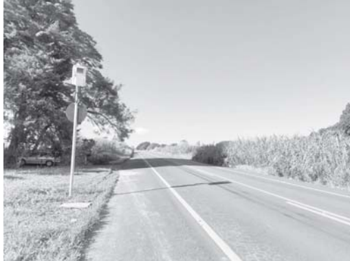
Radar foi instalado em local onde não ocorre acidente, sendo preferido lugar em que vários acidentes já foram registrados

incompetência de quem deveria ser responsável e cuidar para melhorar o trânsito e não faz o que precisa fazer", observa. Ela disse que ainda tem esperança de um dia ver o trecho devidamente sinalizado.