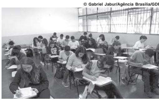
cal do exame.

A publicação do Instituto Nacional de Estudos e Pesquisas Anísio Teixeira (Inep) traz também critérios para correção das provas e procedimentos para pessoas que precisam de cuidados especiais durante o concurso, bem como orientações sobre horário e lo-