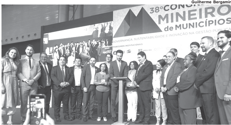
Em solenidade no 38º Congresso Mineiro de Municípios, o governador em exercício e presidente da ALMG, deputado Tadeu Martins Leite, sancionou lei sobre transposição e transferência de saldos financeiros da saúde para prefeituras

"São recursos que estavam parados, por questões burocráticas, correndo até mesmo o risco de serem devolvidos.