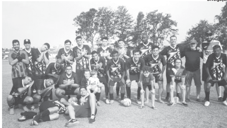
Equipe do Santa Cruz comemorou a classificação após as penalidades

Desta forma ficou definido que Athletic x Omega vão disputar a terceira colocação. O título de campeão da Segunda Divisão será definido na partida entre a Portuguesa x Mocoquinha. Os jogos ainda não tinham data, horário e lo-