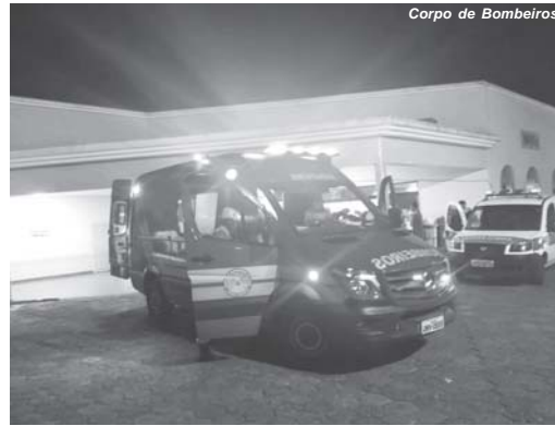
Vítima foi resgatada e levada para Santa casa em estado grave

Vários policiais militares que faziam ronda no centro da cidade em busca do autor de um assalto na agência do Correios, no centro da cidade foram deslocados para o atendimento da ocorrência de