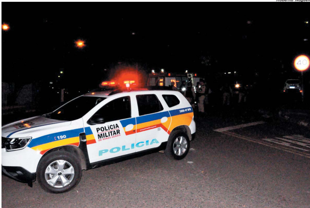
Polícia saiu em rastreamento e teria prendido um suspeito em fuga em São Tomás de Aquino

Paraisense é vice-campeão no 40.º Enduro da Independência