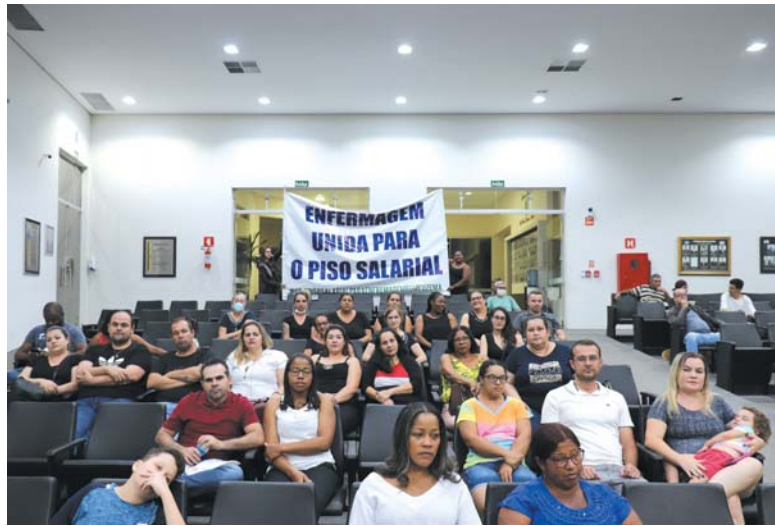
Representantes do setor ocuparam plenário da Câmara e foram apoiados na reivindicação pela implantação do Piso Nacional da Enfermagem