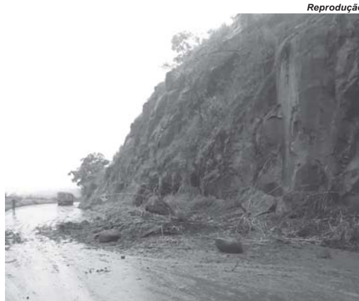
Deslizamento de grande volume de terra interditou o trânsito na MG-444 em Capetinga