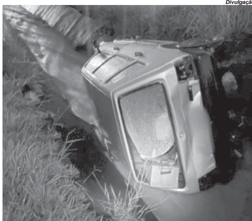
Os dois acidentes foram registrados praticamente no mesmo horário, mas em diferentes regiões da cidade

Com a colisão a moto foi projetada ao solo e a condutora permaneceu caída até a chegada do resgate dos Bombeiros. Sofreu lesões moderadas nas pernas e braços, sendo atendi-