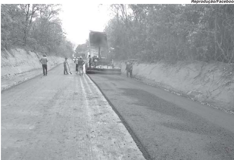
Projeto que abre crédito suplementar adicional de R$ 500 para asfalto da Guardinha, deu entrada na sessão do dia 24 de agosto