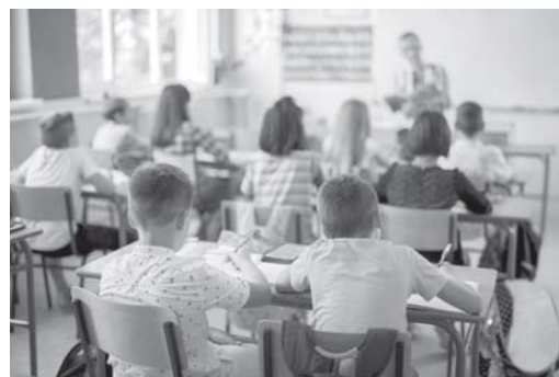
Escolas de Paraíso alcançam bons resultados no Ideb ano base 2019

Como parte dos números históricos dessa edição do IDEB, a Secretaria de Estado de Educação (SEE) destaca também o expressivo aumento da participação dos alunos do ensino médio na realização da prova, fruto de uma mobilização realizada entre Superintendências Regionais de Ensino e diretores das escolas da rede.