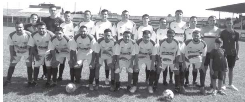
Olhos 'Água continua surpreendente e vai fazer a final da Série B da Taça Paraíso

Precisando de um resultado positivo para levar o jogo para a disputa de pênaltis, o Aipim se lançou ao ataque, e