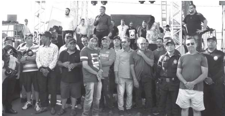
por Nelson Duarte

Em meio a homenagens prestadas a servidores municipais que trabalharam na obra, pronunciamentos ressaltando tratar-se de um marco histórico, dificuldades enfrentadas por moradores ao longo da história do distrito, e desafios para a conclusão, domingo (22/10), foi descerrada placa comemorativa ao asfaltamento da estrada ligando o trecho de aproximadamente 11,5 quilômetros a partir da BR 265 até Guardinha.