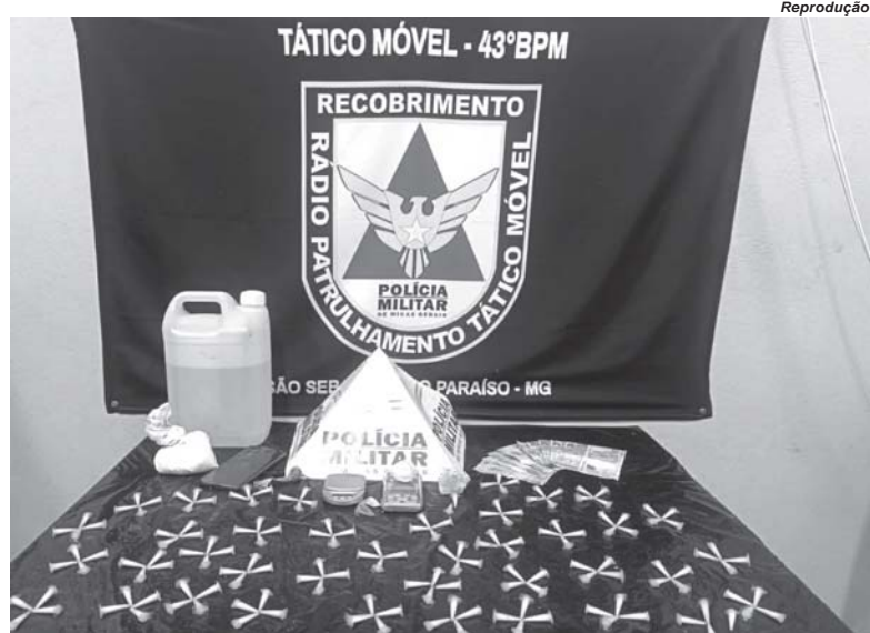
Galão de lança perfume, pedra de crack, cápsulas de cocaína, dinheiro e outros objetos foram apreendidos pela PM durante a operação

Ao ser questionado sobre a existência de algum entorpecente em seu veículo, o suspeito confessou que havia um galão contendo 3,5 litros de uma substância conhecida como lança perfume. Os militares fizeram a busca no carro e localizaram o referido galão no banco traseiro. Em seguida, o suspeito relatou que buscava o entorpecente em Franca (SP) e o revendia em Paraíso. Ele também disse que havia mais drogas escondidas em seu quarto, em sua residência.