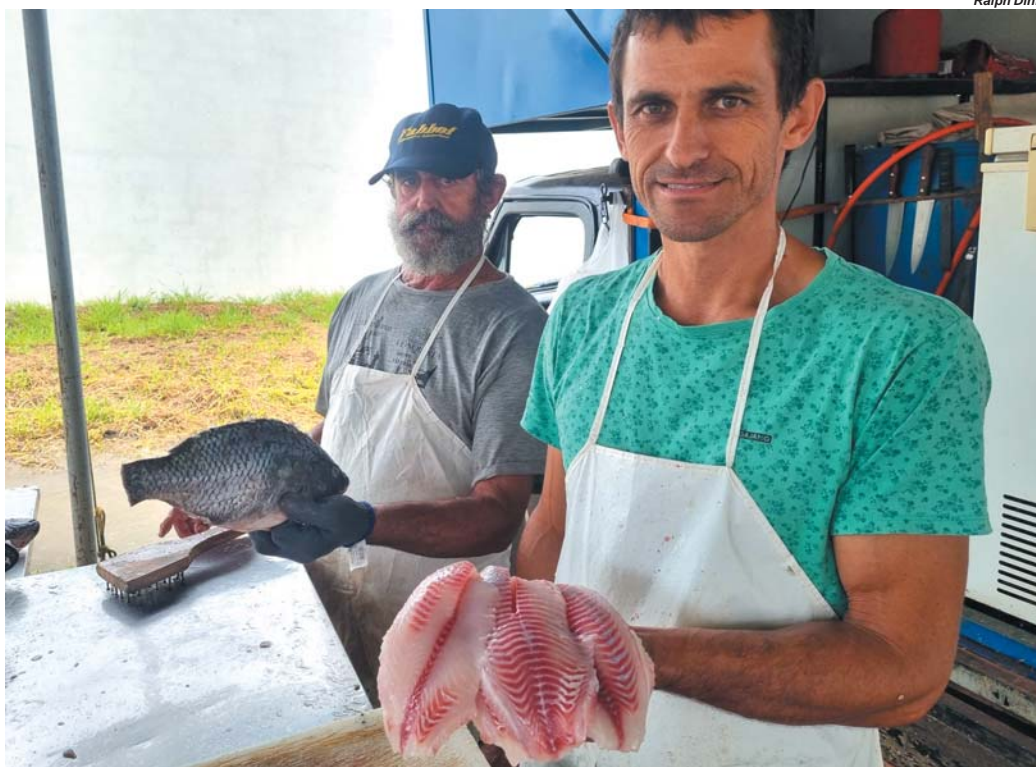
Empresário já conta com um ajudante e deve contratar mais pessoas para atender a demanda da Semana Santa