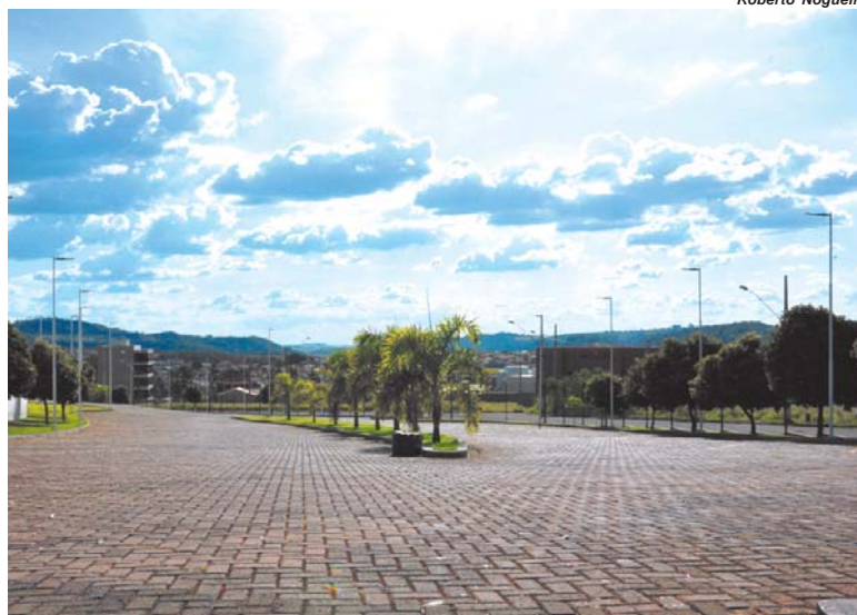
Acusação de superfaturamento na construção do estacionamento, avaliado em mais de R$ 1 milhão, motivou ação