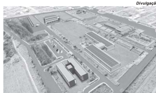
Nova seletiva deve ampliar quantidade de alunos aprovados para o Campus da UFLA em Paraisópolis

A UFLA divulgou novidades para o PAS, entre elas a que as duas primeiras etapas serão formadas por avaliações em apenas um dia, diferente de como era anteriormente, com divisão de conteúdos similar ao Enem: Linguagens e Códigos,