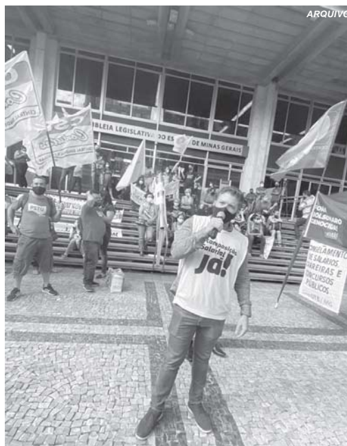
Manifestação foi realizada na porta da Assembleia Legislativa de Minas

A medida abrange servidores que atuam como Professores da Educação Básica (PEB), Especialistas da Educação Básica (EEB), Analistas Educacionais (ANE), Analistas de Educação Básica (AEB), Analistas