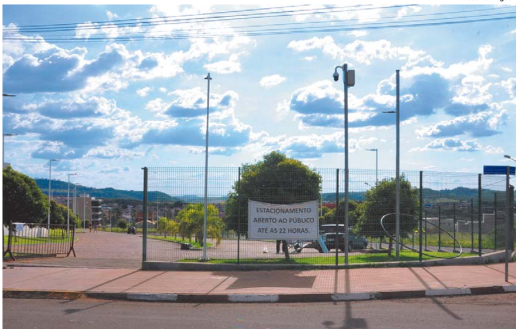
Acusação de superfaturamento na construção do estacionamento, avaliado em mais de R$ 1 milhão, motivou ação

Veteranos de Altinópolis é o novo líder do "Campeonato Regional de Master"