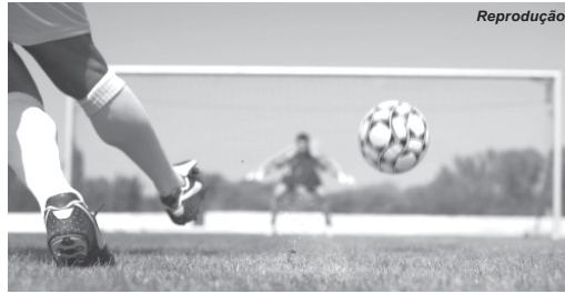
Campeonato tem mais uma importante rodada neste sábado e domingo

A vitória do Veteranos de Altinópolis sobre a Prefeitura de São João Batista do Glória, por 1 a 0 no último final de semana deu a equipe do interior paulista a liderança do campeonato. O time tem 12 pontos, mas poderá ser superada na próxima rodada, uma vez que estará de folga enquanto que o vice-líder Bengala de Guaxupé estará em campo, quando enfrentará a Paraisense. Na parte de baixo da tabela o Clube Veteranos Aquinense continua sem vencer, e soma apenas um ponto em cinco jogos disputados.