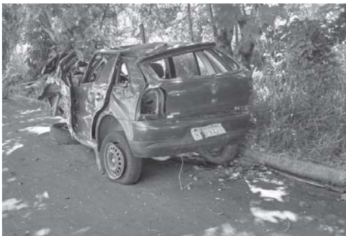
Carcaça de carro abandonado na Rua Armando Amaral, no Cidade Industrial, sendo que existem inúmeras espalhadas nos quatro cantos da Cidade

Em uma cidade em que o quadro atual é de alerta para a população, isto conforme alertas feitos pelo próprio setor de Infectologia da prefeitura, ten-