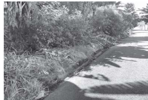
Vejam a sujeira que está nesta calçada da rua Eduardo José do Amaral no loteamento Cidade Industrial, do qual pertence a prefeitura

outras doenças. Basta deixar quintais e terrenos limpos, sem materiais que acumulem água, denunciando vizinhos que não têm este necessário cuidado,