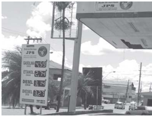
No posto JPS no São Judas Tadeu, onde se vende o preço mais barato do litro do Etanol e Diesel em Paraíso