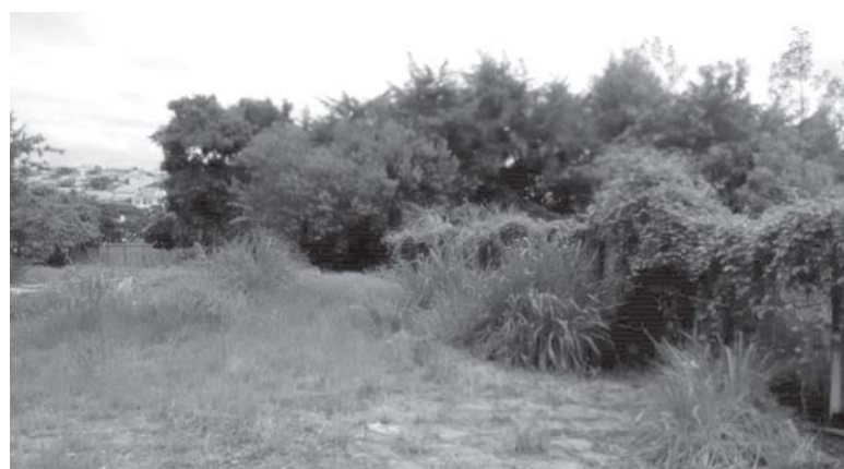
Este matagal fica dentro do terreno da Coolapa que faz fundos com quintais das casas de moradores do Residencial Novo Milênio

e cobrar veementemente atitudes e providências de autoridades para que solucionem os casos.