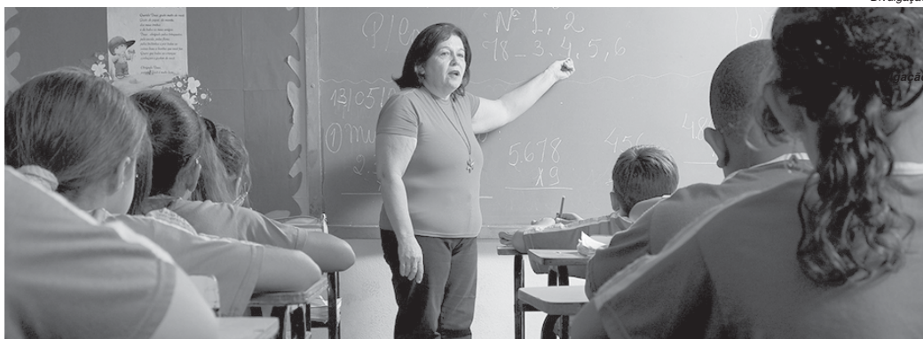
As vagas serão divulgadas por meio de editais afixados na própria escola, na SRE e em locais públicos previamente definidos

A Secretaria de Estado de Educação (SEE) divulgou nesta semana a Resolução nº 4.112 que estabelece normas para a organização do quadro de pessoal para funcionamento das escolas estaduais a partir do ano letivo de 2019. O documento apresenta os critérios para definição sobre distribuição de turmas, aulas, cargos e funções, bem como o quantitativo de servidores para formação do quadro de pessoal das escolas.