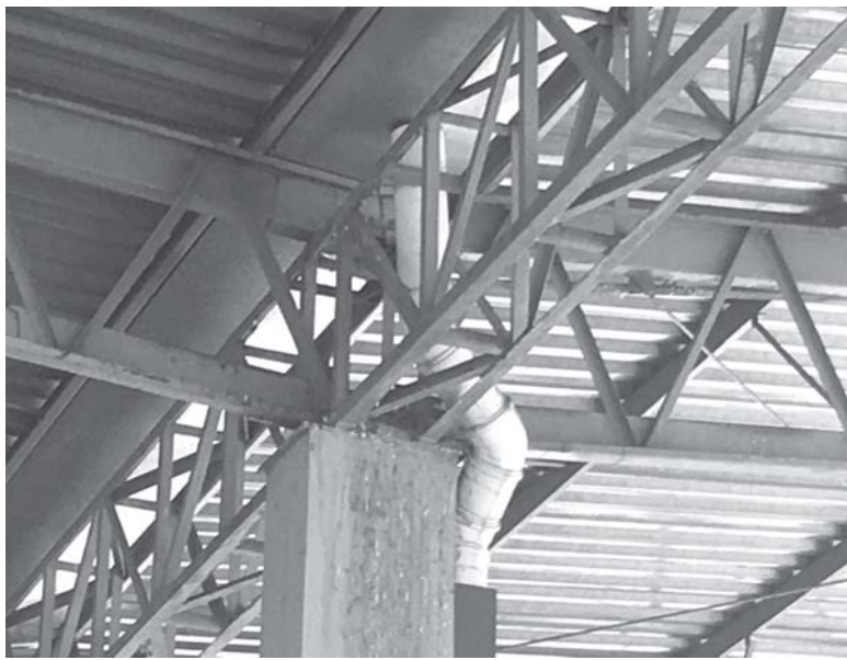
Pombos estão procriando nos pilares da rodoviária

Conforme a coordenadora da Vigilância em Saúde não existe nenhum veneno dispo-