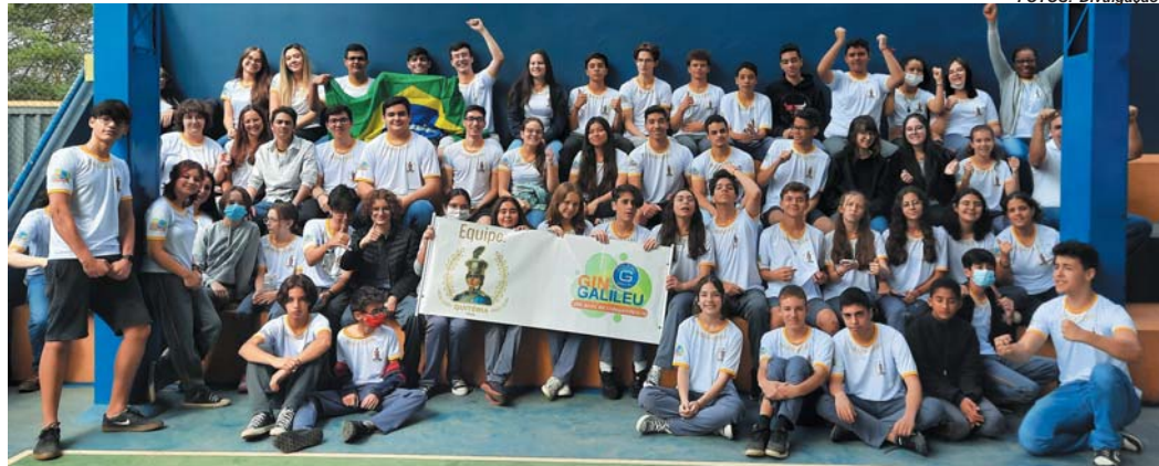
A equipe Quitéria

Segundo a coordenação da gincana, o objetivo não é só recriar fatos de nossa história, mas suscitar também uma reflexão, como é o caso da prova