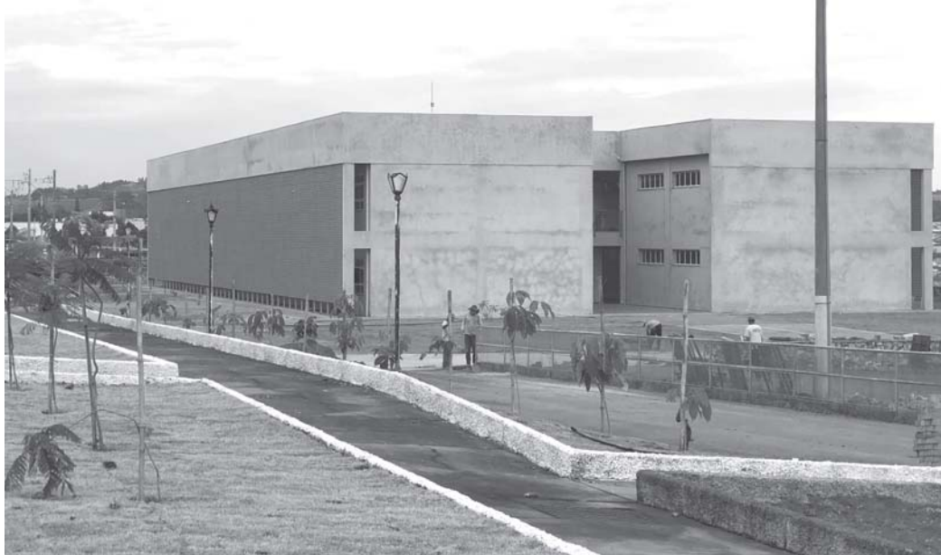
Câmpus Paraíso da UFLA vem sendo preparada para receber mais e novos alunos

Desde 23 de agosto foi iniciado no câmpus Paraíso da UFLA o período de inscrição para as provas do Processo de Avaliação Seriada (PAS 1 e PAS 2) da Universidade Federal de Lavras (UFLA). As provas serão realizadas em novembro de 2022 nas cidades de Lavras e São Sebastião do Paraíso, conforme constam nos editais publicados em julho. As inscrições devem ser realizadas até o dia 21 de setembro no site pas.ufla.br. O pagamento da