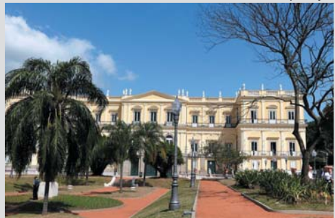
Por Marina Burck* RIO DE JANEIRO

Com investimento de R$ 14,6 milhões, restaurações duraram quatro meses