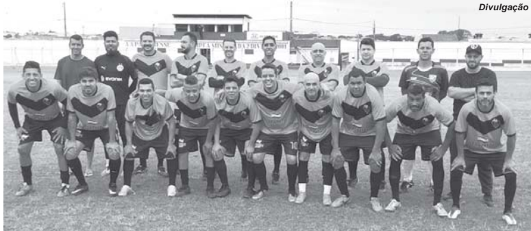
Equipe do TNB tem a melhor campanha do Campeonato após as duas primeiras rodadas do torneio

Com estes resultados o TNB assumiu a liderança isolada da competição com duas vitórias em dois jogos e totaliza seis pontos ganhos. Em seguida estão GNQ-FC Pratápolis, Paraisense, CVA S.T.Aquino e