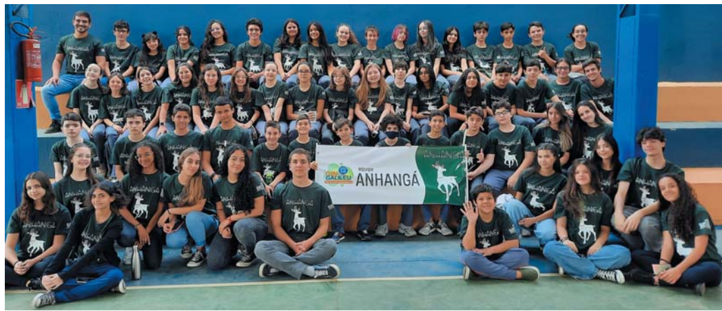
A equipe Anhangá

sobre a Abolição da Escravatura e de como o humor brasileiro, em muitos momentos, assume uma postura crítica.