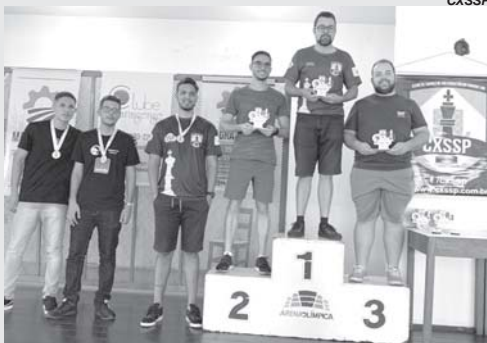
Pódio da categoria absoluto

Em parceria com o Clube de Xadrez de São Sebastião do Paraíso - CXSSP, o tradicional Clube Paraisense, localizado na Av. Pimenta de Pádua nº 1277 centro, sediou a 6ª etapa do 4º Circuito Regional de Xadrez 2022.