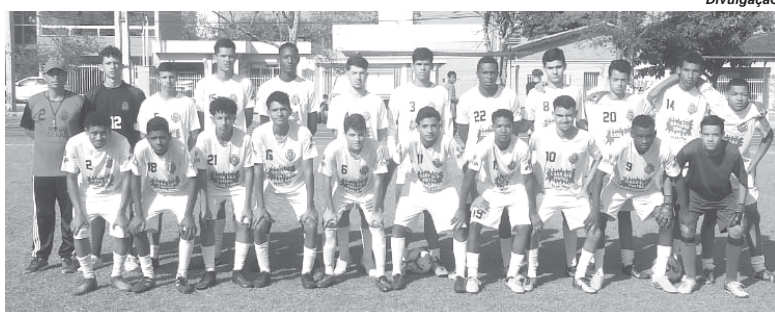
Paraíso Sub-17 faz amistoso preparatório para a segunda rodada da Lidarp

No sábado, 3, no Estádio Municipal Irmãos Capatti a