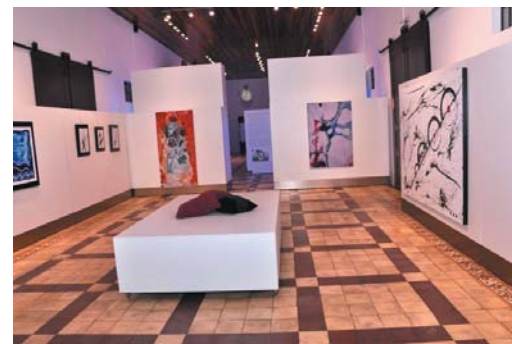
(Secom Pref. SSP)

Na Biblioteca Municipal, o agendamento pode ser feito pelo telefone 3539-1017. Por enquanto o acesso será das 8h às 12h apenas para devolução ou empréstimos de livros, sem permissão para usar o local para leitura. Para cadastro de novos usuários, basta encaminhar uma foto do seu documento pessoal e uma conta de água ou luz recente para o e-mail biblioteca.municipal@ssparaiso.mg.gov.br.