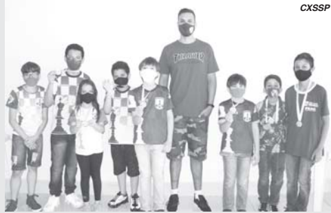
Equipe do CXSSP após premiação

Aconteceu nos dias 24, 25 e 26 de setembro o Campeonato Brasileiro de Xadrez Escolar 2021, na cidade de Caxambu/MG.