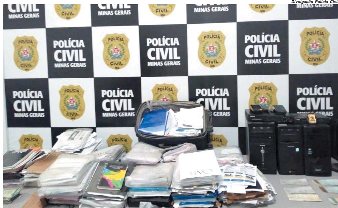
Durante cumprimento de mandado de busca e apreensão foi apreendido farto material que compromete os acusados

Operação Fronteiras e Divisas Integradas acontece em Paraíso