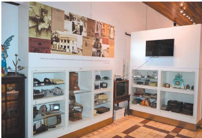
Será necessário agendamento prévio para acesso ao museu ou à biblioteca.

timo de livros, mediante agendamento prévio. Em ambos os locais as pessoas deverão seguir os protocolos referentes à pandemia da Covid, como uso de máscaras e álcool em gel.