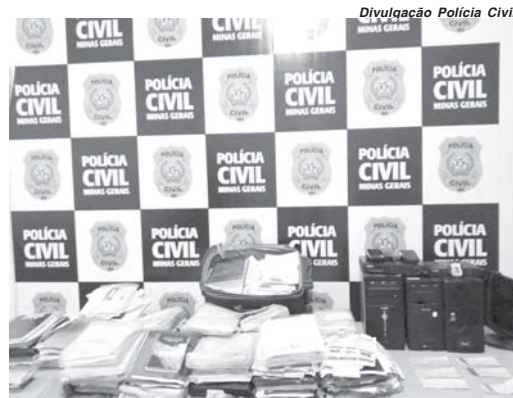
Durante cumprimento de mandado de busca e apreensão foi apreendido farto material que compromete o acusado

civil e de loteamentos para vender consórcios e lesar clientes que faziam os pagamentos integrais das parcelas ou davam lances, mas não recebiam o prêmio contratado, configurando a fraude.