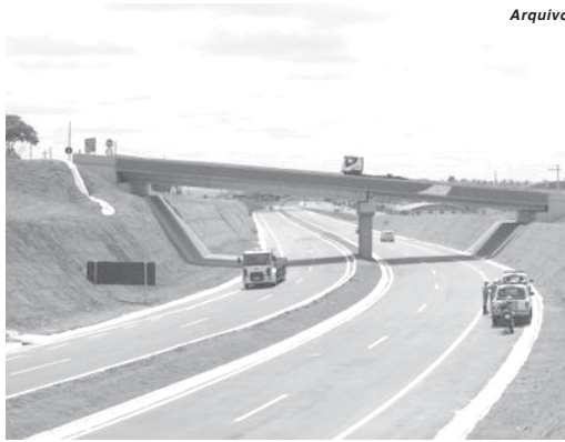
Caso foi registrado no viaduto que corta a rodovia e dá acesso ao bairro Jardim Itamarati

Conforme narrativa dos GCM's que atenderam a ocorrência a mulher estava com uma das pernas sob a mureta de proteção, se preparando para saltar. Em uma ação rápida e utilizando técnicas de contenção, os agentes conseguiram segurá-la e imobilizá-la, tendo em seguida retirando-a do lugar e a encaminhando para local se-