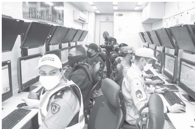
Durante a operação são realizadas diversas abordagens com emprego de forte aparato policial, armas, cães e até um drone é utilizado na fiscalização

De acordo com Peixoto a população ganha com este tipo de operação no combate a criminalidade em geral. "Costumo dizer que se o crime é organizado para prejudicar a sociedade, nos também, como força de segurança, precisamos deste trabalho integrado com todas as instituições e assim combatermos de forma efeti-