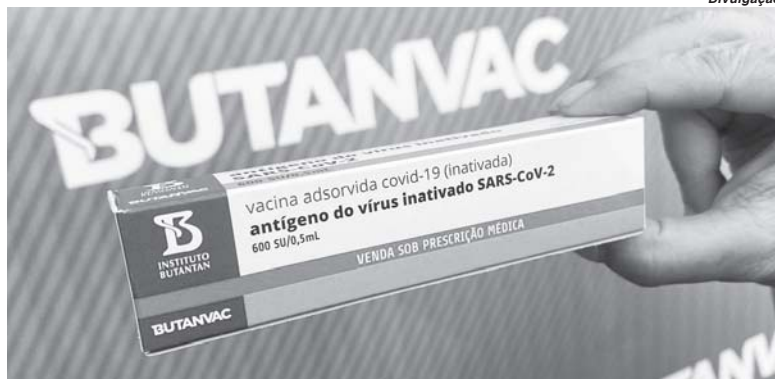
Butanvac a primeira vacina produzida com tecnologia totalmente nacional está sendo testada em voluntários de Paraíso

De forma similar, 14 dias depois da segunda dose, as concentrações de NT50 (título neutralizante a 50%) foram consideráveis. Com base nos resultados do estudo, duas formulações foram selecionadas e devem ser avaliadas na próxima etapa do ensaio clínico, a fase 2. "A vacina inativada tem um perfil de segurança aceitável e é altamente imunogênica. Esta vacina pode ser produzida a baixo custo em qualquer instalação projetada para a produção da vacina inativada do vírus da influ-