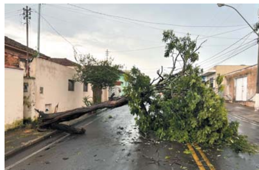
Por Ralph Diniz

Temporal que atingiu Paraíso no último sábado, 25, derrubou muros e árvores, além de arrastar um veículo e inundar casas