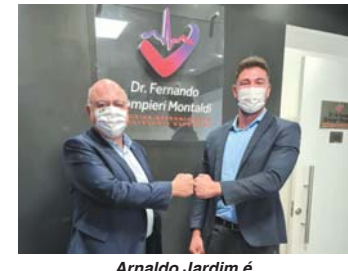
Arnaldo Jardim é deputado de Ribeirão Preto