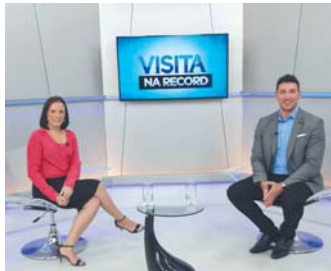
No Programa Balança Geral da Record