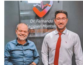
Prefeito Tite Campanella de São Caetano do Sul