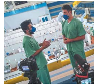
Em Hospital de Campanha