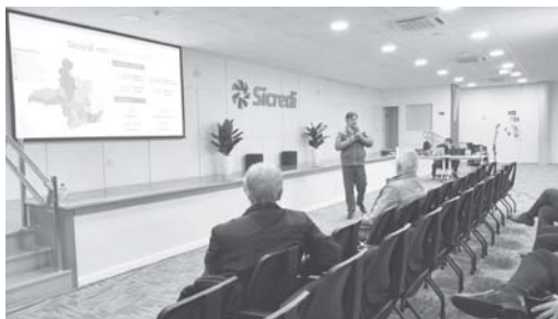
Encontro de coordenadores de núcleo Sicredi das Culturas