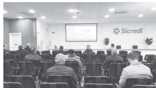
Encontro de coordenadores de núcleo Sicredi das Culturas

Entre os dados apresentados, a Sicredi das Culturas RS/MG finalizou o 1º semestre de