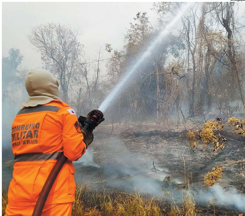
Parque da Serrinha, bombeiros iniciaram o combate ao fogo por volta das 13 horas e a ocorrência foi finalizada às duas da madrugada de terça