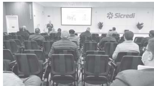
Encontro de coordenadores de núcleo Sicredi das Culturas

Em reunião realizada na última semana, a cooperativa Sicredi das Culturas RS/MG apresentou os resultados do 1º semestre deste ano em reunião com coordenadores de núcleo. O encontro realizado em Santo Augusto/RS e transmitido por uma plataforma digital aos coordenadores de núcleo do Rio Grande do Sul e de Minas Gerais, reforça o modelo de atuação democrático da instituição financeira cooperativa, no qual garante transparência, segurança e valoriza a participação dos associados, que são os donos do negócio.