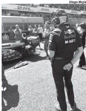
Uma mudança de Adrian Newey seja para qual equipe for, será uma grande notícia e um bem tanto para o lado técnico quanto esportivo da F1

Dinheiro não é problema nas três cartas sobre a mesa e vale lembrar que os salários dos pilotos