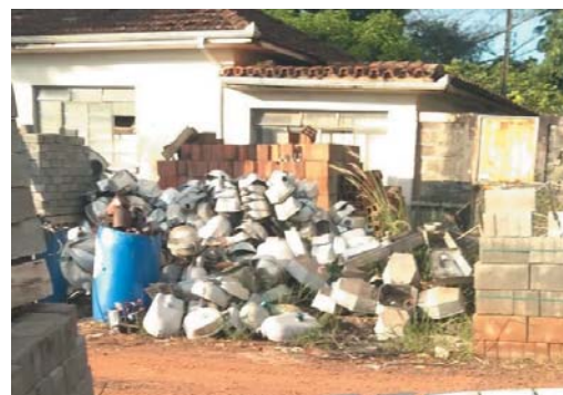
Preocupados, pedestres e moradores das imediações, denunciam terreno sujo, sem calçada e com depósito de objetos que podem acumular água de chuva e se tornar foco criadouro do mosquito da Dengue

minhar dentro desta via pública, porque além de não ter calçada, está cheia de mato.