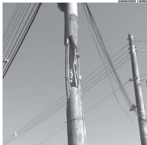
Na Av. Jerônimo Diogo Pereira, no Residencial Novo San Genaro, poste condutor de energia elétrica está em estado de conservação precária

A reportagem do JS foi ao local verificar de perto, e constatamos que realmente bem ao meio o poste condutor de fiações de energia elétrica e demais serviços o concreto se esfacelou, ficando com ferragens expostas. Fica de frente para a Av. Jerônimo Diogo Pereira, fazendo esquina com a Rua Nestor Gonzales Benício, no Residencial