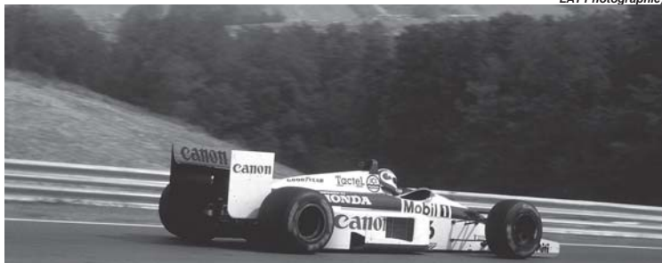
Nelson Piquet com a Williams no GP da Hungria de 1986, autor da mais bonita ultrapassagem de todos os tempos na F1