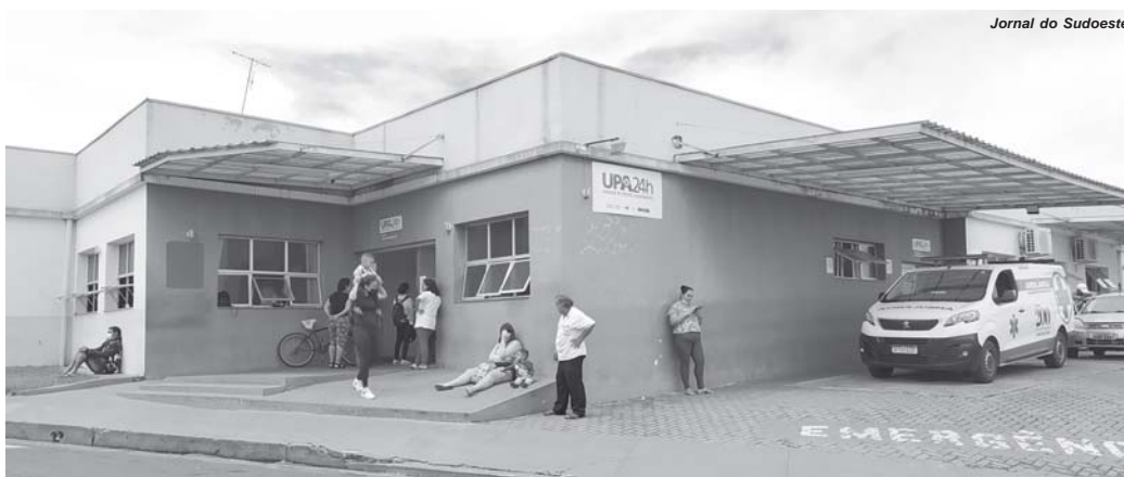
Jornal do Sudoeste

Conforme explica Moraes, o número de pessoas que procuraram atendimento na UPA neste mês é 70% maior do que o registrado em janeiro deste ano. Em fevereiro, a demanda já havia sido 35% mais alta em relação ao primeiro mês de 2023. "Entretanto, nenhuma pessoa que vai até a UPA fica sem atendimento. Todas