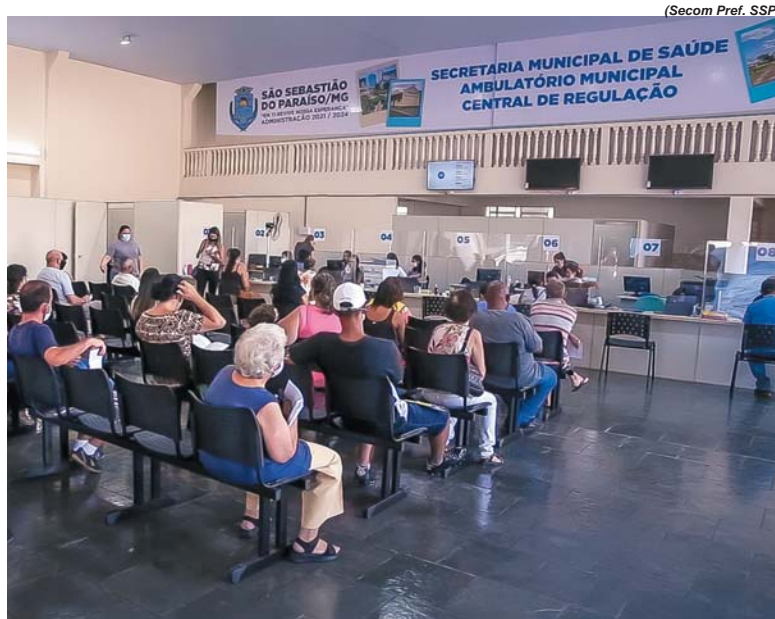
(Secom Pref. SSP)

"Temos consciência de que ainda há muito o que ser