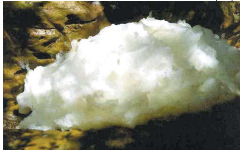
Acúmulo de espumas no córrego Bosque

O documento ainda afirma que, no dia 21 de dezembro de 2018, as obras para conclusão das elevatórias e travessias estavam paralisadas. Já no dia 28 março deste ano, constatou-se que algumas foram reiniciadas e que, segundo a Copasa, serão concluídas até setembro de 2019, atingindo 95% do tratamento do esgoto sanitário. Caso isso não aconteça,