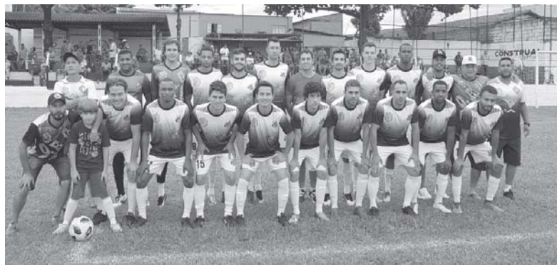
Operário joga em casa e conta com apoio da torcida para obter vitória nos 90 minutos iniciais da decisão