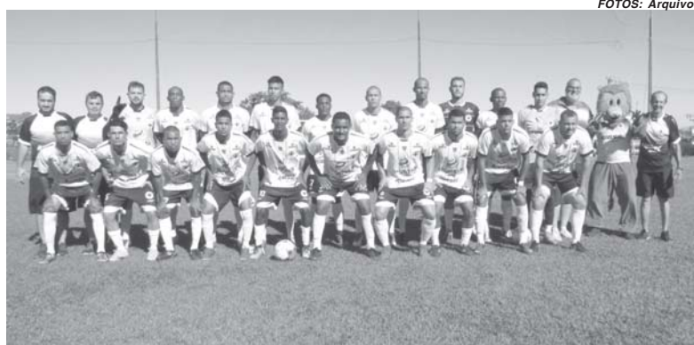
Equipe do Santa Rosa de Viterbo é impulsionada pela fanática torcida, joga por música

Para chegar a decisão o Operário fez uma missão que parecia impossível. O Falcão Negro já havia jogado e perdido três vezes para Brodowski, inclusive o primeiro jogo da semifinal quando saiu de campo com o placar adverso de 1 a 0. No jogo de volta, domingo passado, no interior paulista, o Operário venceu por 2 a 0 e reverteu a vantagem conquistando a vaga para a final.