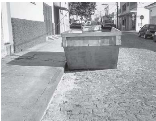
Caçambas na Rua Ananias Alves Ferreira, centro, sem nenhuma fita refletiva

Infelizmente, constatamos que em vez ser solucionado o problema aumentou. Sendo assim, alertamos autoridades para que verifiquem, fiscalizem e tomem medidas necessárias porque poderá haver acidentes