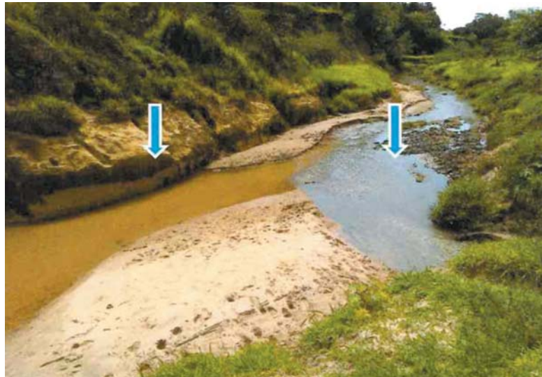
Córrego Rangel (28/03/2019), ponto de mistura do córrego limpo com esgoto bruto