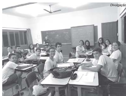
Segunda etapa da Olimpíada de Matemática acontecerá em setembro com 106 mil estudantes mineiros

A segunda fase se caracteriza pela aplicação de prova discursiva, de caráter classificatório, composta de seis questões valendo até 20 pontos cada, totalizando 120 (cento e vinte) pontos. Na primeira etapa da competição, foram 54.831 escolas e mais de 18,1 milhões de alunos inscri-