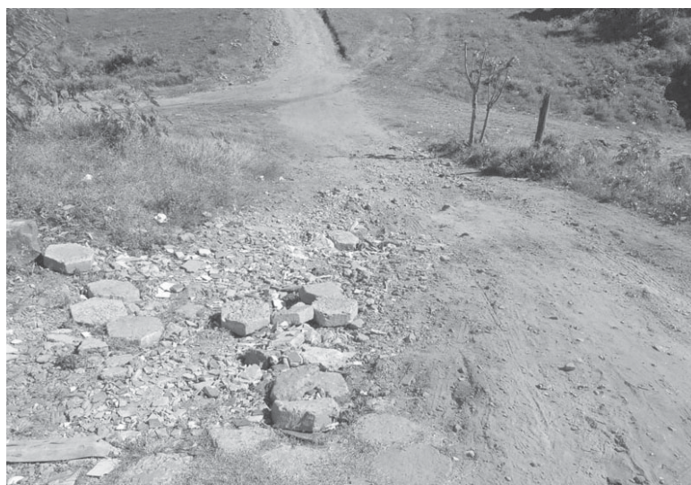
Rua Carlos Piccirillo que liga os Bairros Nossa Senhora Aparecida e Vila Operária, precisa terminar o calçamento