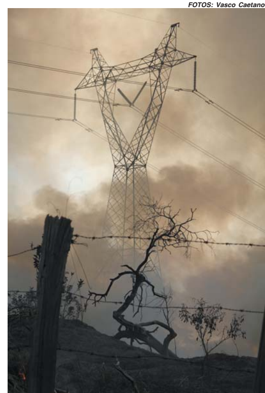
Vários pontos de incêndio foram registrados durante a tarde em Paraíso