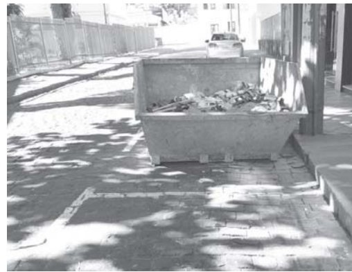
Caçamba sem nenhuma fita refletiva na Praça Comendador João Alves, Fonte Luminosa - Centro