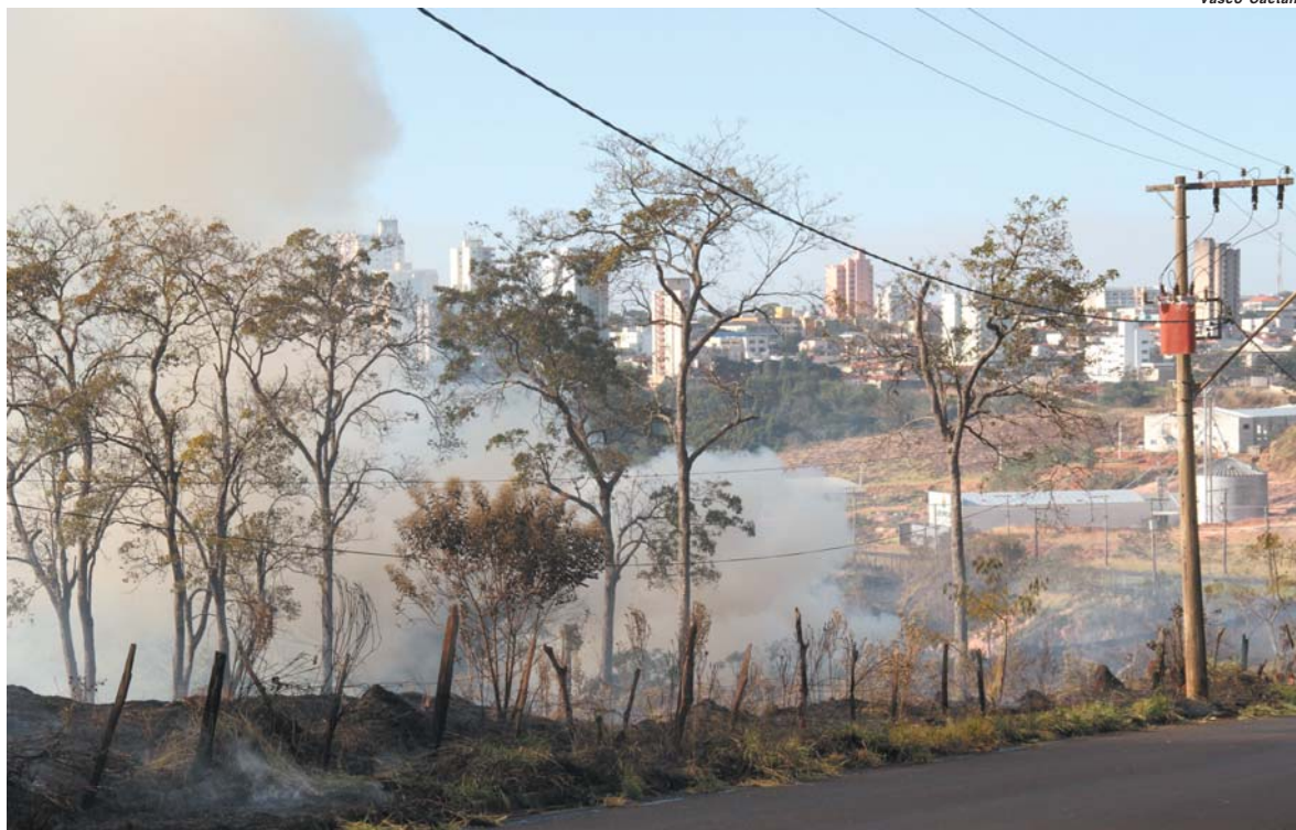
Crime de queimada pode gerar multa de R$ 3 mil em Paraíso