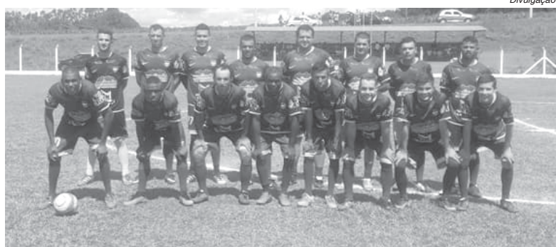
Cerrado de Itamogi jogará em casa, neste domingo, contra a Portuguesa de Passos

A surpresa negativa do campeonato neste ano é o América de Monte Santo de Minas que não vem realizando uma boa campanha. O time que foi