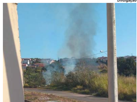
Fogo ao lado de área de preservação permanente no Jardim Canadá

Mata Atlântica e de cerrado. A área queimada pode ser estimada em pelo menos 10 campos de futebol. Além de pássaros e gado a região abriga também alguns animais nativos.