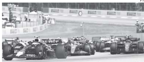
F1 retorna das férias agitadas para a sequência de 9 GPs em 13 finais de semana

A F1 viveu uma de suas férias mais agitadas de todos os tempos. Não faltou pauta para a imprensa e nem assunto para mesa de bar nesse intervalo entre os GPs da Hungria e da Bélgica que, aliás, pode estar recebendo a categoria pela última vez, já que o contrato com a F1 ainda não foi e nem deverá ser renovado. O Circuito de Spa-Francorchamps passou por extensa reforma sem perder as características do traçado visando se adequar para receber corridas de moto.