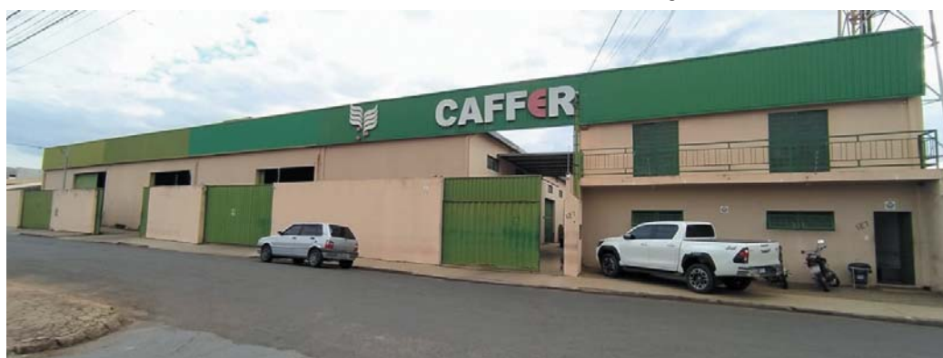
Armazém e escritório na rua Rita Borges Libório, 127, Jardim Vitória

ductor precisa de você e nós estamos ali prontos a auxiliar”, cita.