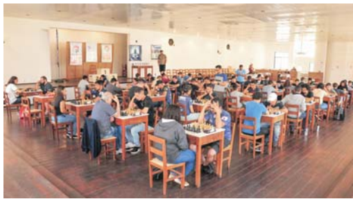
Salão social lotado - 60 Enxadristas