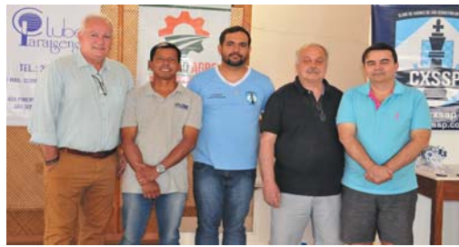
Parceria de sucesso entre diretorias do Clube Paraisense e Clube de Xadrez