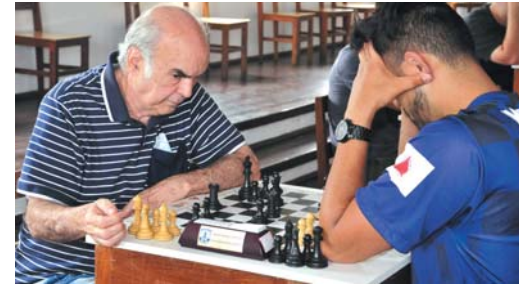
Concentração de um campeão