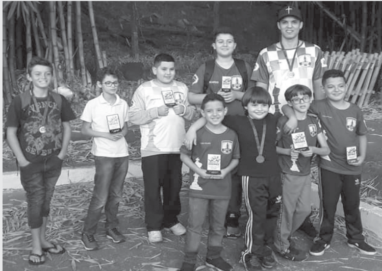
Equipe paraisense brilhou em Ribeirão no fim de semana passado

Aconteceu no último domingo, dia 23/6, a quarta etapa do terceiro Circuito Regional de Xadrez na cidade de Ribeirão Preto/SP.