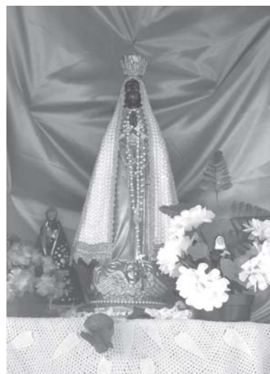
Nova imagem de Nossa Senhora Aparecida foi doada e instalada no tronco de uma árvore