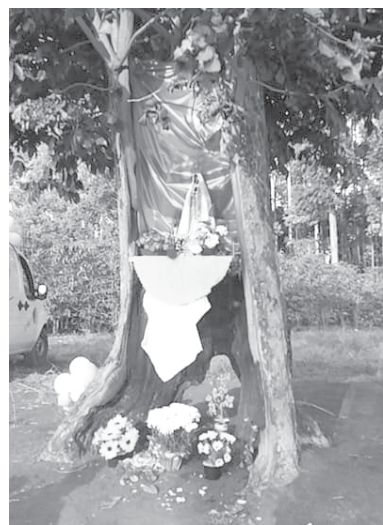
Após o incêndio espaço devocionario foi revitalizado e continua recebendo a visita dos fiéis