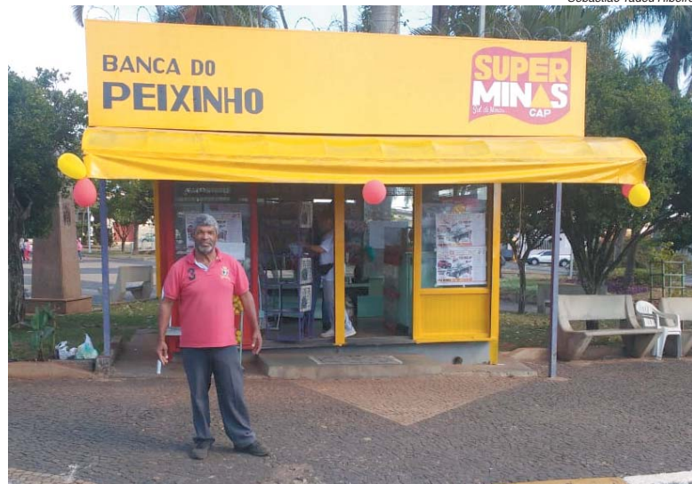
Leitores e fregueses do alto da Mocoquinha e Bairros adjacentes, estão contentes com o retorno das atividades da Banca de Jornal na Praça da Abadia