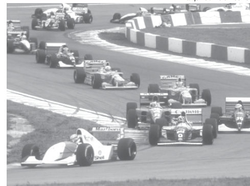
Se sair de Interlagos, em pouco tempo a Fórmula 1 vai embora e não volta mais

Caro leitor, escreva o que tenho dito, ou guarde esta coluna: "Se a Fórmula 1 sair de