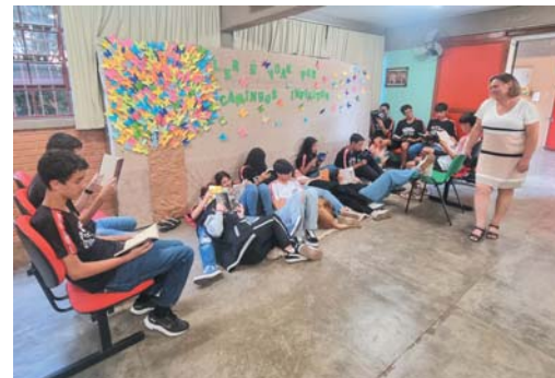
Estudantes demonstraram interesse pela leitura e lotaram o espaço da feira durante os três dias de evento

revelarem ao mundo do que suas mentes criativas são capazes.