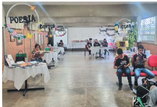
Ambiente da feira foi preparado e decorado por professores, bibliotecárias e alunos do Didão