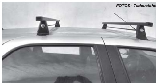
Pesquisando preços, consumidor economizou de pagar R$ 270,00 a mais por bagageiro

Nesta semana mesmo um consumidor e leitor entrou em contato com o Jornal do Sudoeste e explicou, que segunda-feira passada, (30/1), precisando de efetuar a compra