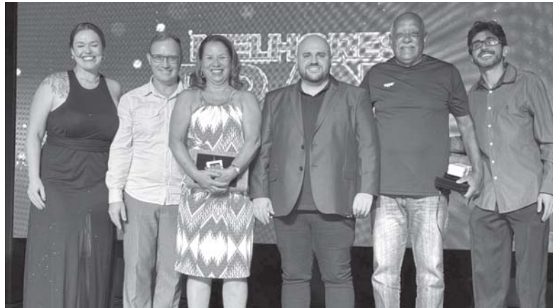
Homenagem foi entregue no último sábado, 3, pela FMH em Belo Horizonte

Reconhecimento marca a contribuição de três décadas da educadora física ao esporte em São Sebastião do Paraíso