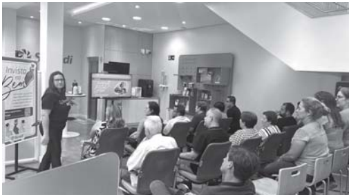
Entrega de recursos da ação Invista no Bem em São Sebastião do Paraíso

Invista no Bem: ação solidária da Sicredi das Culturas RS/MG entrega recursos à comunidade