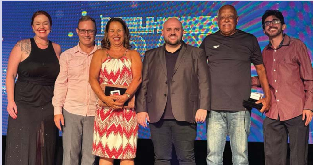
Homenagem foi entregue no último sábado, 3, pela FMH em Belo Horizonte