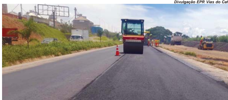
Rodovias do Sul de Minas recebe manutenção e conservação nesta semana

Durante os dias de festividade, estão previstas atividades com interdição parcial ou