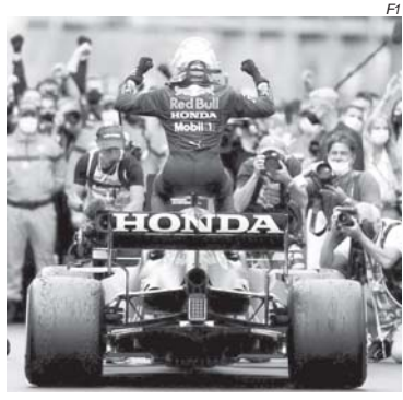
Verstappen pode conquistar o bicampeonato na casa da Honda

Mas nem tudo está sendo festa para a Red Bull desde que surgiram rumores em Singapura de que ela e a Aston Martin teriam ultrapassado o limite do teto orçamentário de US$145 milhões que entrou em vigor no ano passado, e se o estouro ultrapassar os 5% toleráveis, pode haver punições que podem ir de uma simples repreensão, até uma possível desclassificação do campeonato.