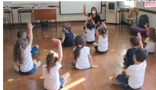
Aula bilíngue com alunos do infantil: um novo mundo lúdico

Não é novidade que o Colégio Paula Frassinetti sempre traz inovações pedagógicas para aprimorar os estudos por toda a Educação Básica. E por meio de eventos ocorridos durante duas semanas, houve muita informação, transmissão de conhecimentos e saberes, além de boas novas para o ano de 2022, sendo a maior delas a implantação gradual do sistema bilíngue.