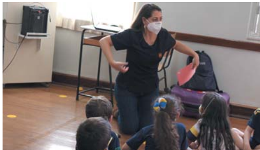
Aula do Programa Bilíngue da International School