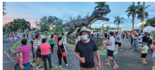
Prefeito Marcelo Moraes

Ao longo do mês, as escolas do Município realizarão visitas às exposições, tanto de experimentos científicos quanto ao Mundo Jurássico. Escolas da região estão vindo, caravanas de cidades chegando em van.