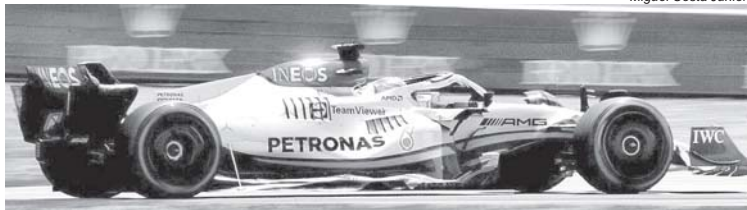
George Russell tornou-se em Interlagos o 113º piloto a vencer uma corrida de F1

O Hamilton cidadão honorário brasileiro, que desfilou com a bandeira do Brasil antes da corrida e levou as arquibancadas abaixo a cada ultrapassagem e aparição ao público. A belíssima interpretação do Hino Nacional na voz da cantora Iza. O primeiro "God Save The King" tocado na F1 - desde o nascimento da categoria em 1950, apenas "Deus Salve a Rainha" fora executado em vitórias de pilotos e equipes britânicas, o que dá uma dimensão da longevidade do reinado de Elizabeth II, que faleceu em setembro.