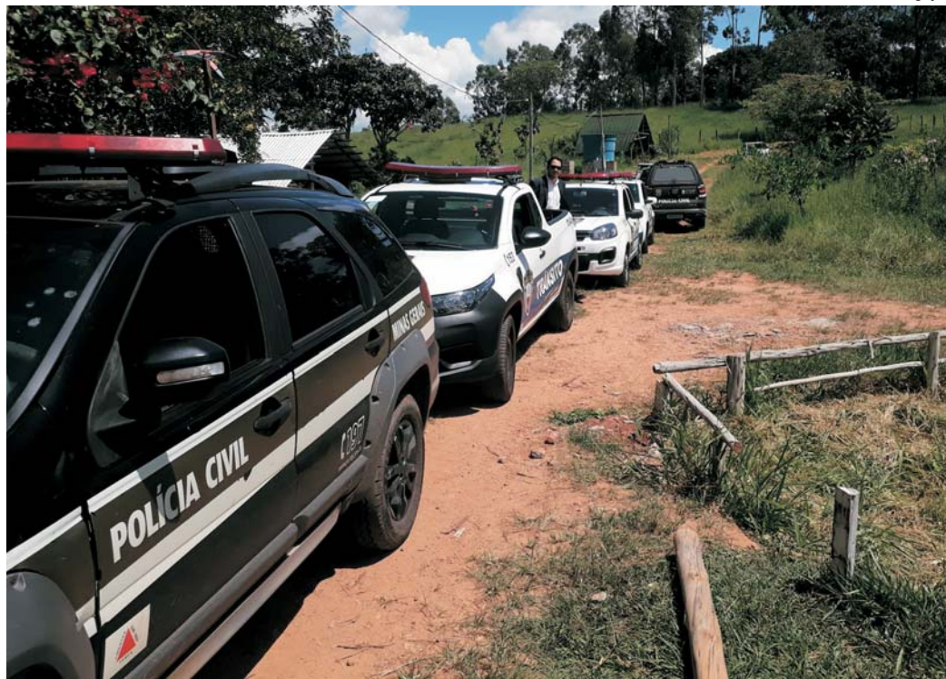
Na propriedade na zona rural de Paraíso foram encontrados cerca de 60 pés de maconha