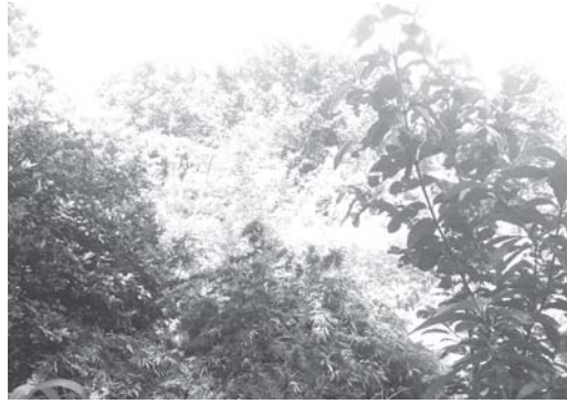
Na propriedade na zona rural de Paraíso foram encontrados cerca de 60 pés de maconha

Uma operação policial resultou na localização, apreensão e destruição de cerca de 60 pés de maconha que estavam sendo cultivados em uma chácara na zona rural de São Sebastião do Paraíso. O trabalho da Polícia Civil contou com o apoio da Guarda Civil Municipal que atuou conjuntamente na abordagem e também na eliminação da plantação. Conforme apurado pelo Jornal do Sudoeste pelo menos três pessoas teriam sido detidas e um quarto ele-