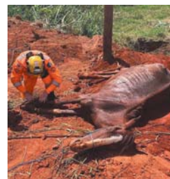
Em Paraíso foram capturados no início da semana um gambá e um garrote. Bombeiros de Guaxupé resgatam uma cobra jibóia e uma égua

Já em condições, as cordas foram puxadas possibilitando o resgate do animal e o retorno dos bombeiros para parte de cima do terreno. Conforme relatado pelos resgatistas é que a melhor parte da operação é que o garrote encontra-se bem e