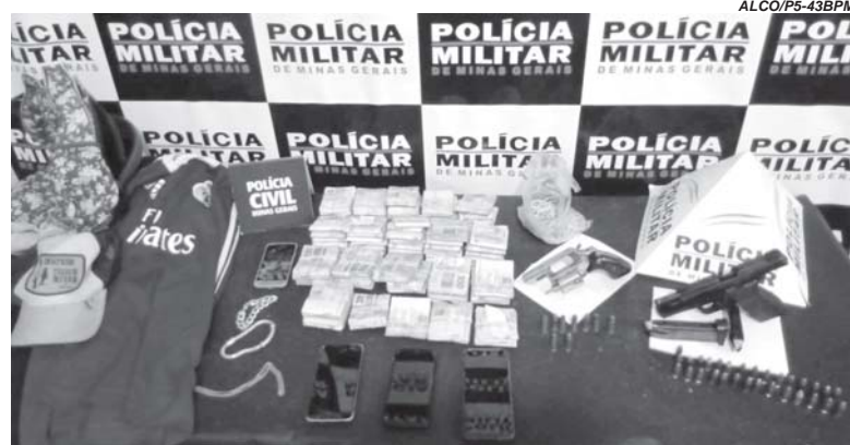
Arma e parte do dinheiro roubado foram recuperados pela PM em uma propriedade rural

Accionada, a Polícia Militar, através do compartilhamento de dados e informações conseguiu chegar até uma propri-