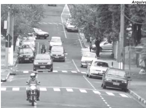
Contribuintes são chamados a pagar o imposto até a partir da próxima segunda-feira

Conforme levantamento realizado junto ao Departamento Nacional de Trânsito (Denatran) em sua base de dados, no município paraense estão cadastrados 51.252 veículos. No entanto, o relatório informado não separa eventuais carros que podem ser isentos de tributação. Ainda de acordo com o Portal da Transparência do Governo do Estado, em 2021, foram repassados a Paraíso R$12.991.615,11 referente ao IPVA.