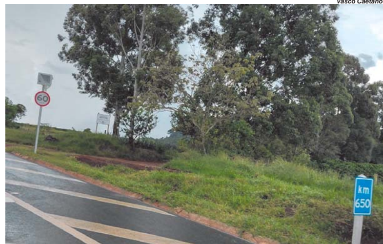
Equipamento está em fase de montagem na BR-265 em mais uma forma de tentar evitar acidentes

"Com a ampliação dos contratos de fiscalização eletrônica de velocidade, além de inibirmos o desrespeito à lei em