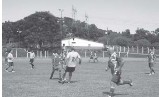
Assim como em anos anteriores Caram e Senior's vão se enfrentar na quarta rodada do campeonato

Quatro partidas, disputadas no final de semana, marcaram o início da segunda fase do Campeonato Regional de Master's 50. Os Veteranos de Termópolis e o Altinópolis/Batatais venceram seus compromissos e largaram na frente nesta etapa da competição. No próximo sábado, 7, e também no domingo, 8, a bola volta a rolar com a realização de mais duas partidas pela segunda rodada da competição.