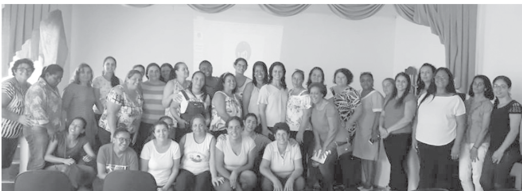
Professores Participantes do evento

O Projeto defende com propriedade a necessidade do mundo atual e a Reciclagem, Educação Ambiental, Noções Básicas de Sustentabilidade e Prevenção de doenças causadas por condições do ambiente em que se vive.