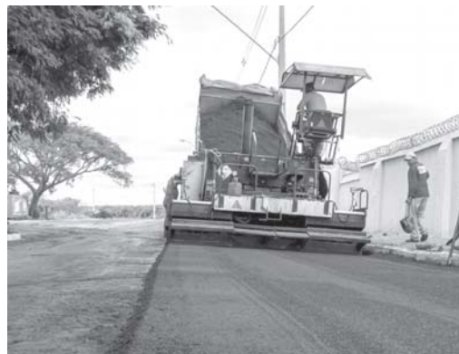
Obra que faz parte da infraestrutura da cidade de São Tomás de Aquino. Asfalto, trecho após Avenida da Saúde, sentido Parque de Exposição. Local onde acontece a Festa do Peão, uma tradição da cidade.