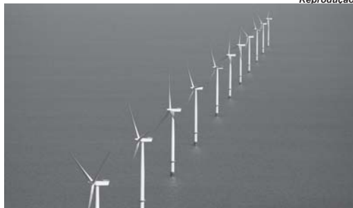
Reprodução Estatual firma acordo que amplia parceria com empresa privada

Por Rafael Cardoso Repórter da Agência Brasil RIO DE JANEIRO