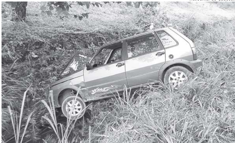
Tiel/Jornal do Sudoeste

Segundo Bombeiros, a vítima sofreu ferimentos leves e foi conduzida para atendimento na Santa Casa, por ser paciente cardíaco-crônico e estar com a pressão arterial alterada.