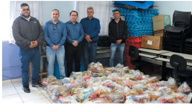
Centro de Referência da Assistência Social (CRAS)

Ainda no dia 14, as cooperativas encaminharam 76 cestas bá-