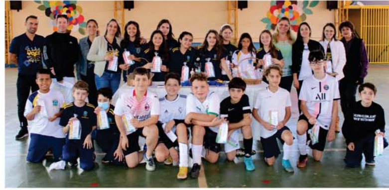
8º Lugar na Avaliação Nacional COC

Ser medalhista em uma Olimpíada Estudantil é um marco na vida de qualquer aluno. Seja medalha de ouro, prata ou bronze, vale a pena disputar e colocar à prova seu próprio conhecimento e