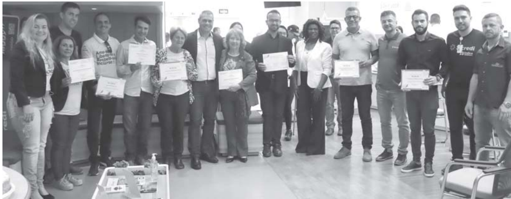
Equipe Sicredi e entidades contempladas em São Sebastião do Paraíso

Desde então, já foram contemplados mais de 700 projetos e destinados mais de R$ 1,7 milhão, beneficiando mais de 400 mil pessoas. Para conferir os projetos contemplados pelo