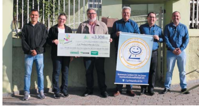
Lar Pedacinho do Céu