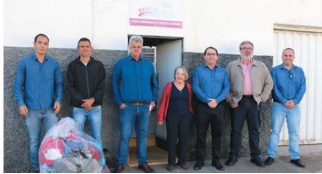
Casa de Apoio Amor Fraternal

cas ao Centro de Referência da Assistência Social (CRAS) para doação às pessoas carentes do município, e mais 144 cestas básicas ao Instituto Inlua, totalizando 220 cestas básicas doadas, quantidade referente ao número de participantes da Corrida de São João.