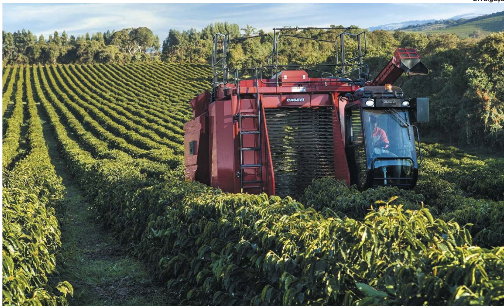
A colheita está atrasada quando comparada aos anos anteriores

Unimed, Sicoob Nossocrédito e Sicoob Paraísocred entregam donativos da Corrida de São João