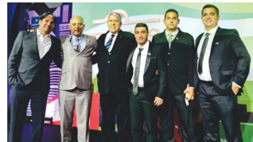
Representantes e Técnicos do Grupo Matsuda