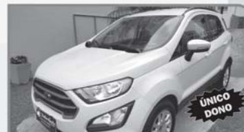
FORD ECOSPORT SE 1.5 12v - FLEX 2018 - BRANCA - COMPLETA - CÂMBIO MANUAL R$ 64.000,00 À VISTA