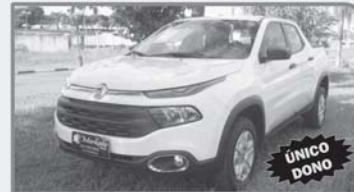
FIAT TORO FREEDOM 1.8 - AUTOMÁTICO - FLEX BRANCA - 2018 - COMPLETO R$ 79.000,00 À VISTA

Avenida Dârcio Cantieri, 2299 - Jardim América - São Sebastião do Paraíso - MG