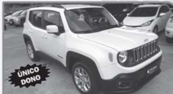
JEEP RENEGADE SPORT 1.8 - FLEX 2016 - BRANCO - COMPLETO - CÂMBIO MANUAL R$ 66.000,00 À VISTA

FINANCIAMENTO DE VEÍCULOS EM ATÉ 60 PARCELAS