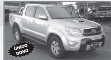
TOYOTA HILUX 3.0 CD 4x4 SRV 2011 - PRATA - COMPLETA - DIESEL R$ 89.000,00 À VISTA