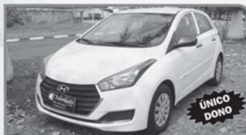
HYUNDAI - HB20 COMFORT 1.9 FLEX BRANCO - 2018 - COMPLETO R$ 41.000,00 À VISTA