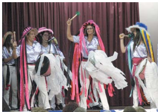
Terno de Congo "Filhas de Paraíso"