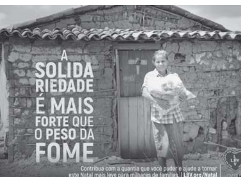
Contribua com a quantidade que você puder e ajude a tornar este Natal mais leve para milhares de famílias. | LBV.org/Natal

MODO DE PREPARAR Tempere a carne com vinho, azeite, alho e sal a gosto. Em seguida empane na farinha de trigo. Tire o excesso e refogue em panela grossa. Após refogada flambrar com conhaque de alcatrão. Em seguida coloque o vinho tinto (para o molho), e acrescente 2 copos de creme de leite e 1 colher de açafrão. Tempere o feijão com alho e coloque cebola por cima. Quando estiver pronto coloque o caldo do feijão por cima do arroz com salsa e cebolinha verde. Frite as batatas e coloque junto ao arroz. Prato pronto, bom apetite.