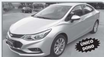
GM CRUZE LT 1.4 TURBO FLEX - 2017 PRATA - COMPLETO R$ 80.000,00 À VISTA