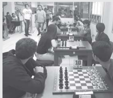
Clube de Xadrez de São Sebastião do Paraíso recebeu o Circuito Regional no último domingo