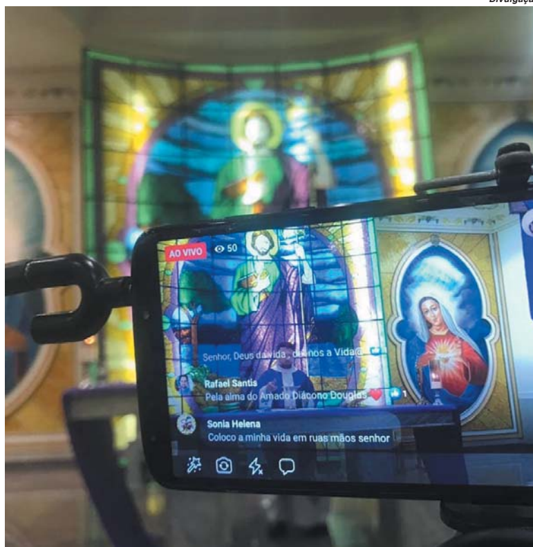
Sem a presença de fiéis igrejas evangelizam pelas redes sociais

Ele destaca que neste tempo diferenciado, marcado pela pandemia e que exigiu uma renovada postura evangelizadora, foi perceptível o fundamental papel dos meios de comunicação. "O que seria de nossas paróquias e nossa diocese se não fosse o empenho de padres e leigos na utilização estratégica e cristã desses instrumentos de comunicação", indaga. Surpreendido de forma positiva com uso dos instrumentos tecnológicos como formas múltiplas de evangelização ele