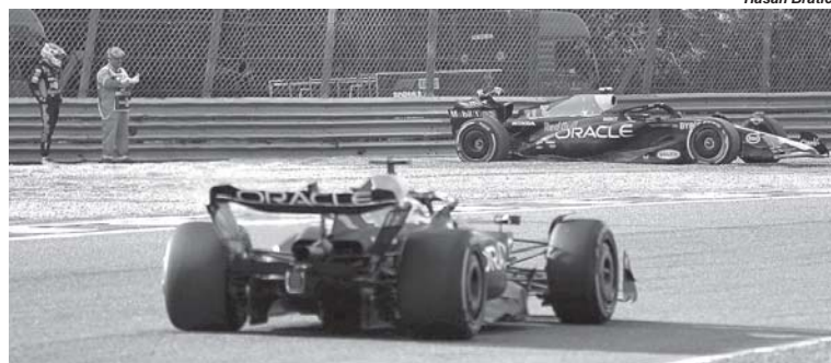
Verstappen passa por Perez (ao fundo) atolado na caixa de brita durante o treino livre em Monza

Sergio Perez faz uma temporada abaixo das expectativas com o melhor carro da F1. A Red Bull venceu as 14 etapas da temporada, doze com Max Verstappen que em Monza tornou-se o único piloto na história da F1 a vencer dez corridas seguidas, superando o recorde que pertencia a Sebastian Vettel desde 2013. E o mexicano venceu apenas duas provas no começo do campeonato - Arábia Saudita e Azerbaijão.