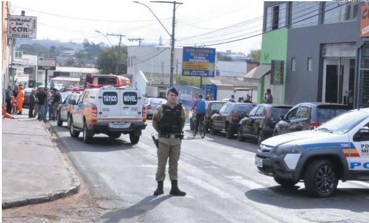
Polícia Militar fez o cerco na região e prendeu dois assaltantes na região do bairro Bela Vista em Paraíso