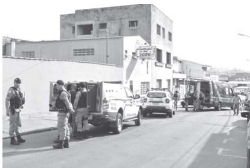
Policia Militar fez o cerco na região e prendeu dois assaltantes na região do bairro Bela Vista em Paraíso

A ação rápida da Polícia Militar resultou na prisão de dois homens que haviam acabado de roubar um escritório de contabilidade, no bairro Bela Vista, em São Sebastião do Paraíso. O crime foi cometido na tarde desta sexta-feira, 9. Os assaltantes adentraram ao local, um deles armado com um revólver, e anunciaram o assalto. A polícia foi acionada e ao chegar ao local dos fatos deparou com os autores em fuga quando foi efetuada a prisão em flagrante dos acusados. Os ladrões fizeram ao menos cinco disparos de arma de fogo. Por volta de 14h30 a Sala de Operações do 43º Batalhão da Polícia Militar foi solicitada por um telefonema por uma pessoa que denunciou a ação