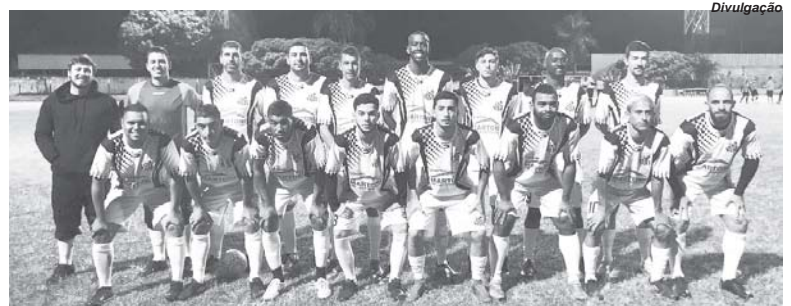
Operário foi uma das equipes convidadas a participar da segunda fase da Taça Paraíso