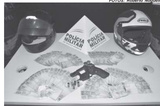
Arma do crime e o dinheiro que seria levado foi recuperado com ação rápida da PM