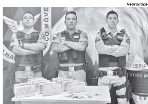
Policiais participaram da apreensão de drogas após denúncia anônima em Paraíso