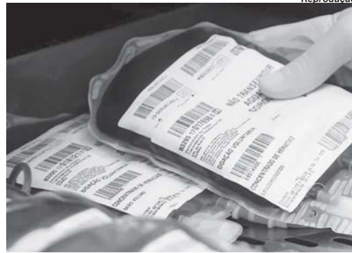
Paraíso necessita e muito da implantação de Hemocentro

Paraíso também tem o Hospital Psiquiátrico Gedor Silveira, também referência no Estado de Minas e atende pacien-