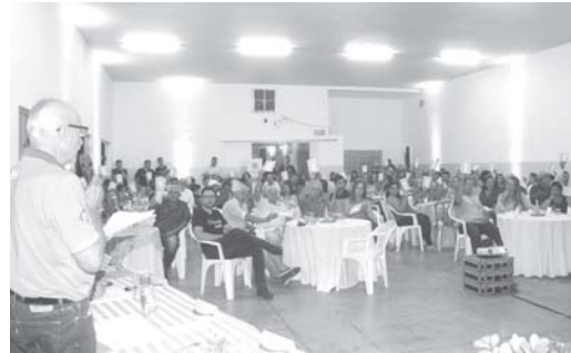
Assembleia em Itamogi