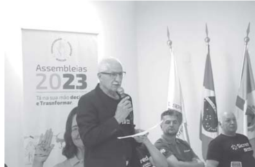
Assembleia em Paraíso