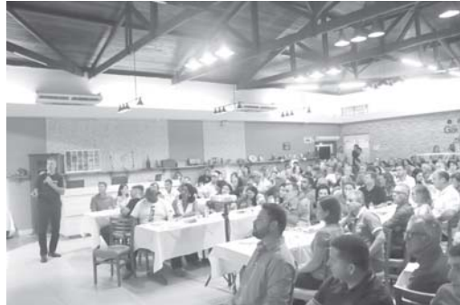
Assembleia em Passos

Na última semana, associados e comunidade de Monte Santo de Minas, Itamogi, São Sebastião do Paraíso e Passos participaram da rodada de assembleias presenciais realizada pela Sicredi das Culturas RS/MG na região. Durante os encontros, são apresentados os resultados de 2022 da cooperativa e definidos os rumos do negócio para 2023. Além disso, são oportunidades para que os associados coloquem em prática o papel de donos, exercendo por meio do voto a sua participação nas definições pautadas para este ciclo assemblear.