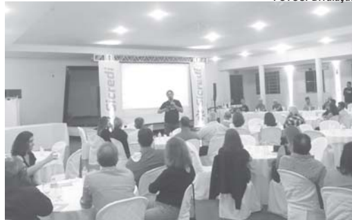
Assembleia em Monte Santo de Minas