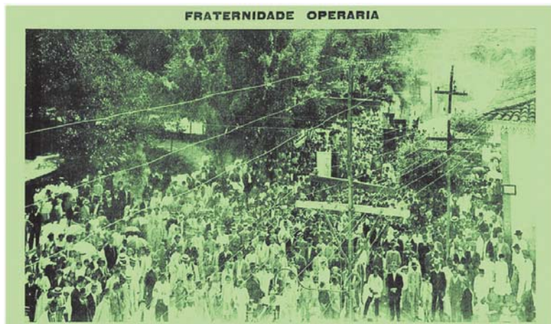
Liga Operária de Cataguases (MG). Foto tirada em frente ao Paço Municipal da mesma cidade. O Malho. Rio de Janeiro, 23 de setembro de 1911