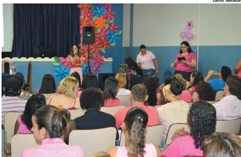
Palestras e eventos com dicas e orientações estão ocorrendo em empresas e escolas da cidade

A programação prevê para o dia 20 a realização de um mutirão na empresa Cremer. No período de 23 a 27 acontecem exames no caminhão "Expresso da Vida", que ficará estacionado ao lado da Unidade de Pronto Atendimento (UPA), atendendo apenas mulheres da zona rural. O encerramento da campanha será no dia 31 deste mês com a tradicional caminhada Outubro Rosa, com saída às 8h30 da