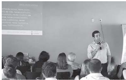
Kepler falou sobre Impactos da tecnologia na geração de empregos