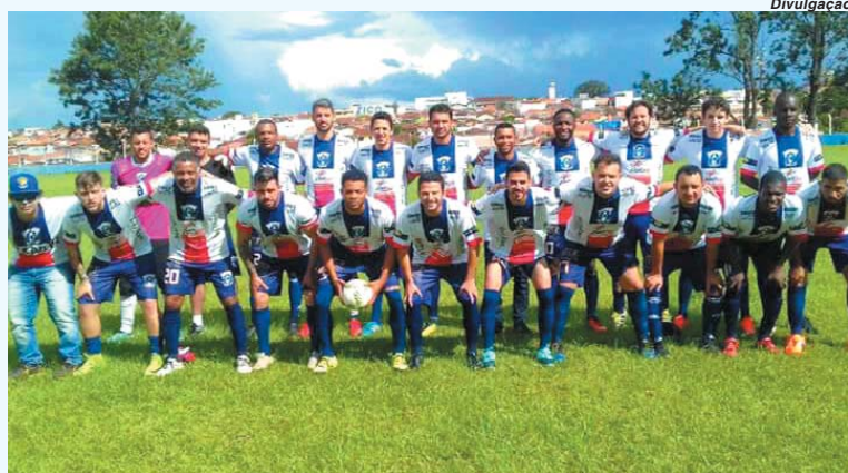
Time da Vila Dalva obteve conquista inédita na disputa da Segunda Divisão da Taça Paraíso

Fica aqui o registro pelo Jornal do Sudoeste da equipe da Vila Dalva que conquistou título inédito em sua história. O campeonato teve o seu encerramento no último domingo, 28. Na partida final a equipe enfrenta