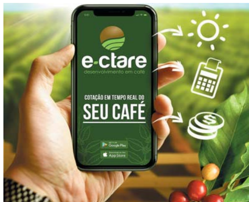
Aplicativo desenvolvido por paraisenses informa cotação do café e variações na Bolsa de Valores

Para saber mais detalhes, o produtor pode acessar a página virtual do aplicativo por meio do endereço eletrônico "www.ectare.com.br". O E-ctare já está disponível nas lojas de aplicativo Google Play (para aparelhos Android) e App Store (para iPhones e iPads).