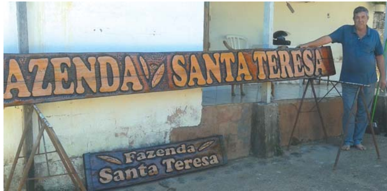
Carpinteiro já produziu mais de 200 peças em um trabalho que iniciou-se como passatempo e ganhou outra dimensão

Embora a carpintaria seja uma das profissões mais antigas da humanidade, nos tempos atuais ela é exercida utilizando os recursos que a tecnologia disponibiliza hoje em dia. Os