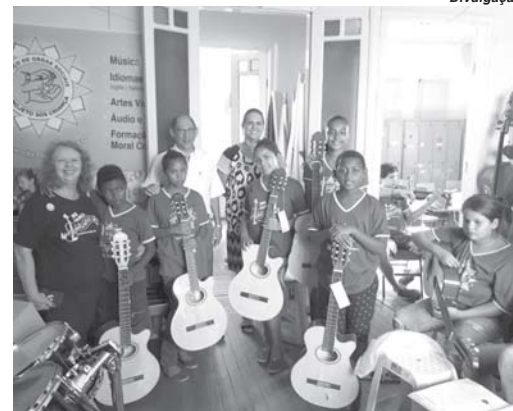
Novos instrumentos foram entregues pelo Rotary Clube ao grupo SOS de Paraíso

Todos os anos, o Rotary Club de São Sebastião do Paraíso desenvolve vários projetos sociais que atendem necessidades da comunidade local de sua região. As ações são realizadas utilizando-se de recursos próprios e também do Programa de Subsídios Distritais da Fundação Rotary. Neste ano a entidade contemplada foi o Serviço de Obras Sociais que tem em seu trabalho um projeto a partir de uma filarmônica de cordas.