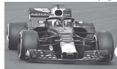
As atenções estarão voltadas para Mercedes e Ferrari, mas é bom ficar de olho na Red Bull

No bloco intermediário a disputa deve ser bem mais apertada que nos anos anteriores. Isso porque a Force India, 4ª colocada no Mundial de Construtores de 2016 e 2017, parece ter perdido força - principalmente financeira - e se vê seriamente ameaçada com o crescimento da McLaren, agora com os motores Renault, e da própria Renault que no final do ano passado já vinha dando sinais de evolução. Ainda neste bloco podemos inserir, quem diria, a Toro Rosso-Honda(!), isso mesmo. A Honda deu tremendo salto de qualidade na pré-temporada, permitindo à equipe satélite da Red Bull ser a terceira que mais andou na pré-temporada (3.635,5km), atrás apenas da Mercedes (4.841,2km) e da Ferrari (4.324,4km). E o mais importante foi ter enfrentado poucos problemas mecânicos,