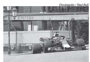
Daniel Ricciardo pulverizou os cronômetros em Monte Carlo e desponta como favorito a vencer o GP de Mônaco

Resta saber como se comportará os carros da Mercedes com esses pneus pelo fato de o modelo W09 ter como tendão de Aquiles os compostos mais macios da Pirelli, principalmente em asfalto liso como o de Mônaco. E também a Ferrari que está sendo 'vigilada'