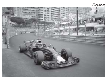
Problemas mecânicos não impediram Daniel Ricciardo de vencer o GP de Mônaco

Mas por que o GP de Mônaco foi tão ruim assim? Primeiro porque o risco de fazer uma segunda troca de pneus para ter o carro mais rápido na parte final da prova e ficar preso atrás de carros mais lentos era maior do que perder a posição em que se estava. Segundo porque sem a chuva ou Safety Car, a corrida vira mesmo procissão. Mas existem outros dois fatores interferindo